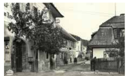
Richter - Gebäude - Schneeweißbauer - und - Bacher