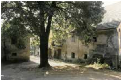
Innenhof - Schneeweißbauer