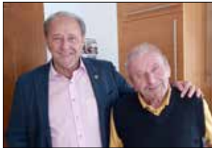
† Torta Herbert 90 Jahre