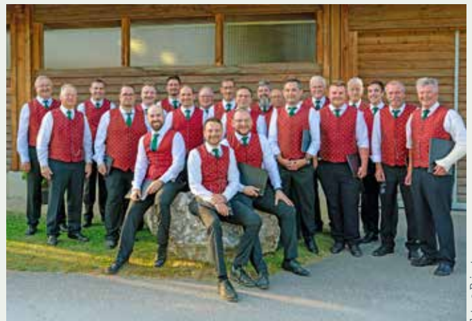
Die Sängerrunde St. Michael freut sich bereits auf einen unvergesslichen Liederabend in der örtlichen Festhalle.