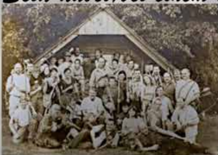
BC Ragnitz, 8413 St. Georgen, Badendorf 18

Die Teilnahme am Turnier erfolgt auf eigene Gefahr. Der Veranstalter übernimmt keine Haftung für Verletzungen bzw. Schäden an der Ausrüstung Das Turnier findet bei jeder Witterung statt.