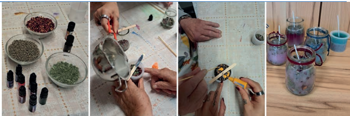
In der Tagesbetreuung hergestellte Duftkerzen

Tages-Betreuungsstätte für vorwiegend ältere Menschen in verschiedenen Pflegestufen. Montag bis Freitag von 8 bis 16:30 Uhr. Abholung von zuhause wird angeboten.