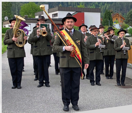
Tag der Blasmusik