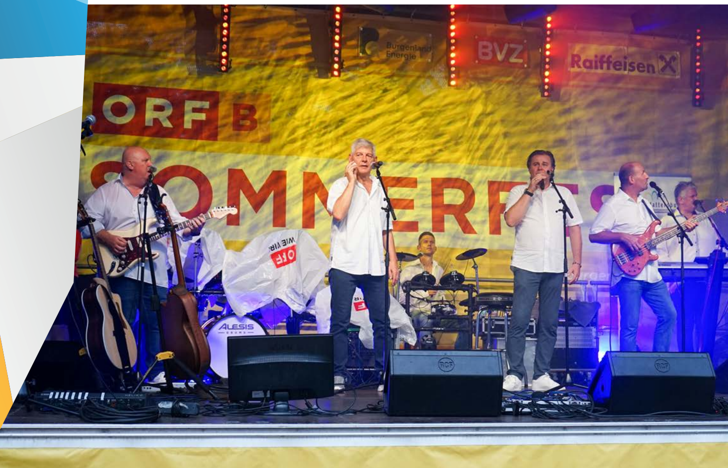
Die Radio Burgenland Band rockte beim ORF Burgenland Sommerfest die Bühne am Veranstaltungsort. Trotz Regen genossen viele einen entspannten Abend voller Musik und Unterhaltung. Mehr dazu auf den Seiten 2/3.