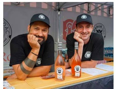
Die Winzer der Rosalia DAC präsentierten ihre edlen Weine.