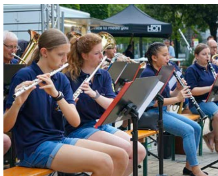
Gestartet hat das StadtKULINARIUM am Freitagabend mit einem Dämmerchoppen der Stadtkapelle.

natürlich aufgrund des Wetters der Platz nicht gefüllt war, konnten wir mit vielen gut gelaunten Gästen einen trockenen Abend mit super Stimmung und angenehmen Temperaturen verbringen“, bilanziert Schlager und ergänzt abschließend: „Ich danke allen Partner:innen, Musiker:innen, Aussteller:innen, Mitarbeiter:innen und natürlich all unseren Besucher:innen, die dafür gesorgt haben, dass wir stolz auf unser erstes StadtKULINARIUM zurückblicken können.“