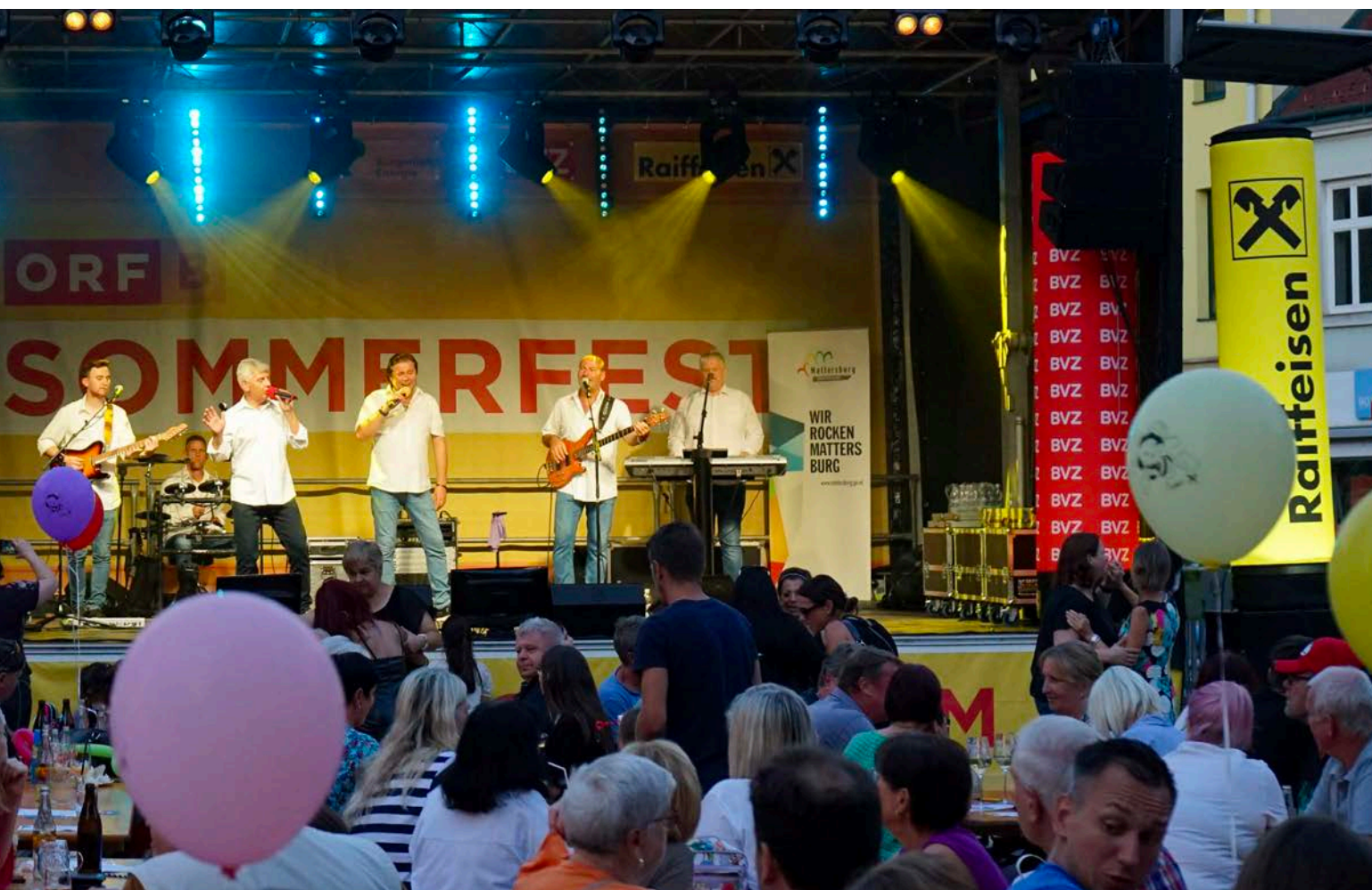
Im letzten Jahr kamen über 1.000 Besucher:innen zum ORF-Sommerfest. Auch heuer freuen wir uns wieder auf ein großes Publikum.

die Burgenland-Band konnten wir auch die Band ‚Crowdfleckerl‘ für ein Gastspiel in Mattersburg gewinnen“, freut sich die Stadtchefin. Sie weist auch darauf hin, dass es neben den Veranstaltungen der Stadtgemeinde auch eine Vielzahl von Veranstaltungen von Vereinen, Institutionen oder Privatpersonen gibt. Ein Blick in den Veranstaltungskalender auf der Homepage mattersburg.gv.at lohnt sich immer, um auf dem Laufenden zu bleiben. Dort können sich Interessierte auch für Erinnerungsmails zu Veranstaltungen anmelden.