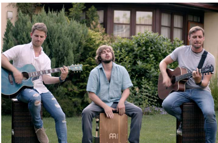
Neben der Radio Burgenland-Band konnten wir „Crowdfleckerl“ gewinnen, die mit rockigen Austropopklängen die Gäste begeistern werden.

Übrigens: Alle Vereine und Unternehmen können sich auf der Homepage der Stadtgemeinde registrieren und ihre öffentlichen Informationen und Veranstaltungen selbst verwalten und erstellen. „Ein großer Vorteil, um diese Informationen ohne bürokratischen Aufwand immer aktuell zu halten“, so Schlager.