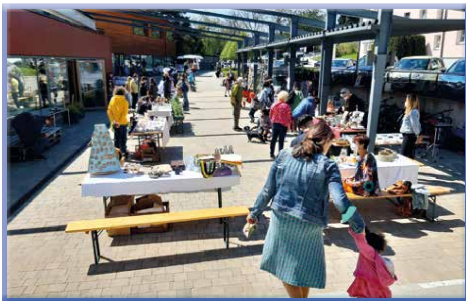
Ein Blick auf einen Monatsmarkt im Sommer 2021

Als Fixpunkt im Veranstaltungskalender gilt der beliebte Eichgrabner Monatsmarkt. Er findet jeden ersten Samstag im Monat, von Mai bis November vor dem Gemeindezentrum statt und bringt so Eichgrabnerinnen und Eichgrabner zusammen. Damit sich der Besuch besonders lohnt, gibt es jedes Mal ein „Special“. Am 7. Mai haben 20 Familien die Gelegenheit, ihre nicht mehr benötigte Kleidung, Spielzeug, Kinderwagen, etc. beim Flohmarkt für Baby- und Kindersachen zu verkaufen.