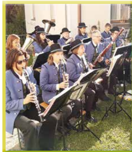
Unsere Vereine sind Säulen der Gemeinschaft

Eichgrabens Vereine gehören zu den Säulen unserer Gemeinschaft und sind ganz wesentlich für die weitere Entwicklung und den Zusammenhalt in unserem Ort.