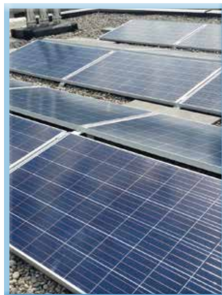
Immer mehr Solaranlagen zieren die Dächer

Grundlage für eine Förderung ist die Energiekennzahlverbesserung