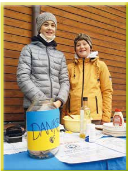
Sammeln für die Menschen in der Ukraine

Wir alle hoffen, dass die furchtbare Situation in der Ukraine bald Geschichte ist. Die meisten hier angekommenen Menschen aus der Ukraine wollen so bald wie möglich wieder in ihre Heimat. Bis dahin können wir nur versuchen, ihnen hier die Zeit so gut wie möglich zu gestalten.