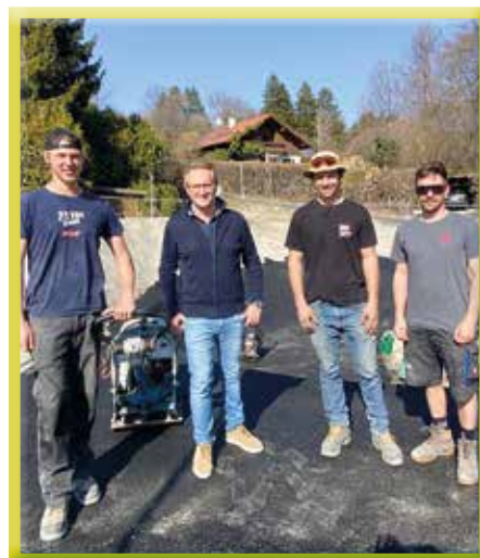
Inspektion der Arbeiten am Pumptrack

Im Rahmen dieses Projekts wird auch der Vorplatz des Wienerwaldbades umgestaltet. Mehr dazu finden Sie auf den Seite 16 und 17.