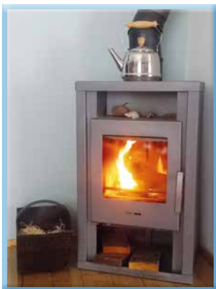
Der alte Holzofen geht wieder in Betrieb

So wie andere Gemeinden auch, hat die Marktgemeinde Eichgraben mit einstimmigem Gemeinderatsbeschluss diesen Betrag verdoppelt und allen, die den NÖ Heizkostenzuschuss des Landes bekommen