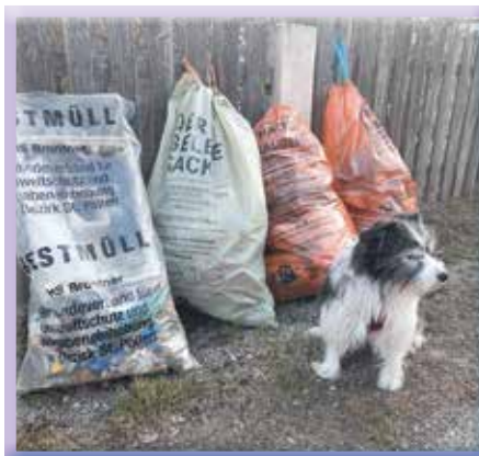
Tristan Häußler bekam Unterstützung