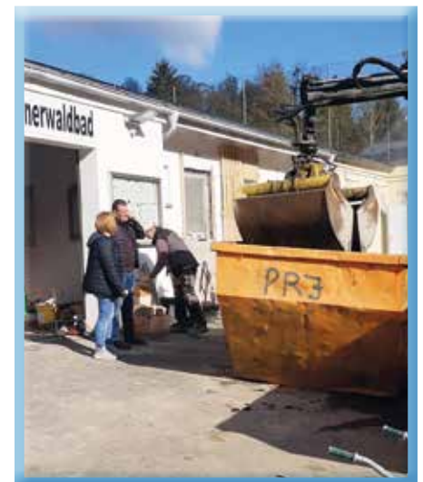
Arbeiten am Außenbereich des Bades

Um das Gesamtbild unseres Freizeitzentrums Wienerwaldbad stimmig und schön abzurunden, planen wir gerade die Gestaltung des Vorplatzes. Eine ansprechende Fassade, erweiterte Möglichkeiten für die Gastronomie, Sitzgelegenheiten und viele weitere Ideen werden gerade erarbeitet und sollen noch dieses Jahr umgesetzt werden.