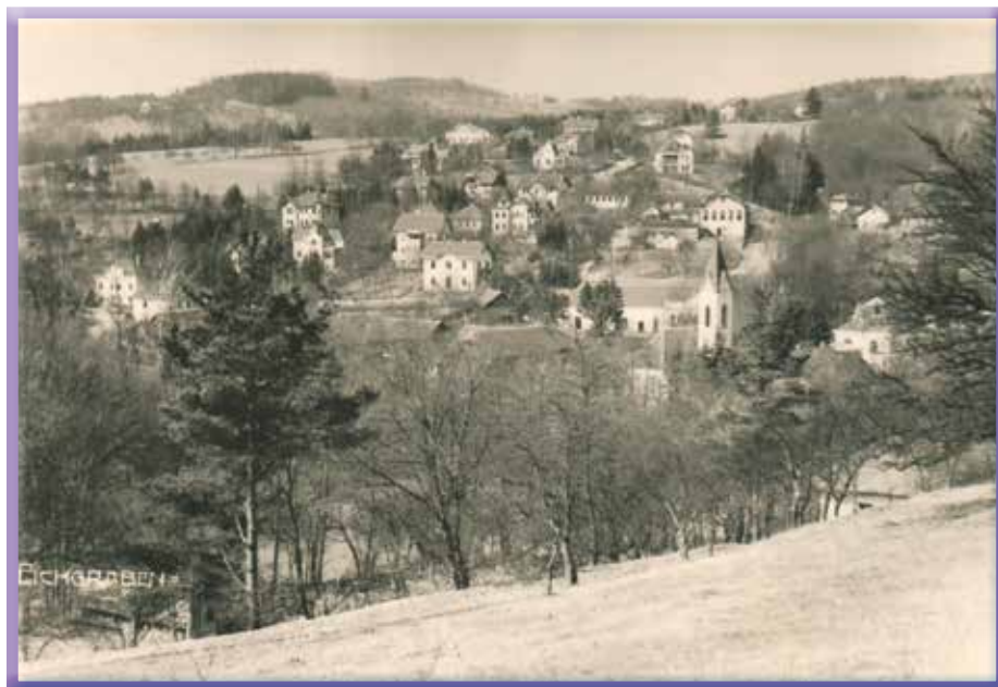
Unser Heimatort im Jahr 1914, als Eichgraben ca. 1400 Einwohner zählte

In den nächsten Wochen und Monaten sollen verschiedene Veranstaltungen geplant und Aktionen ausgearbeitet werden, sodass