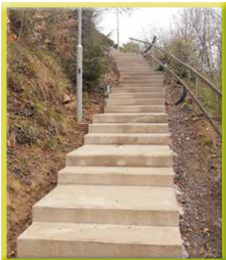
Sicher hoch hinaus auf dem Gartensteig

Mit der „Gehwegoffensive Eichgraben“ wollen wir das Zu-Fuß-Gehen noch attraktiver und sicherer gestalten. Im April beginnen die Arbeiten zur Gehsteigerrichtung in der Badnerstraße. Ich bedanke mich bei den Anrainern für