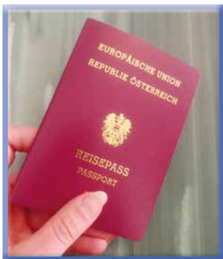
Pass im Bürgerservice verlängern lassen

Das Bürgerservice - gleich im Eingangsbereich des Gemeindeamtes - ist die erste Anlaufstelle für Eichgrabens Bürgerinnen und Bürger. Die vielfältigen Anliegen werden in die richtige Abteilung weitergeleitet oder direkt im eigenen Verantwortungsbereich erledigt.