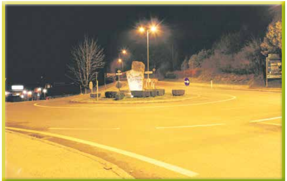
Mit LED Beleuchtung ist auch der zentrale Kreisverkehr immer gut ausgeleuchtet