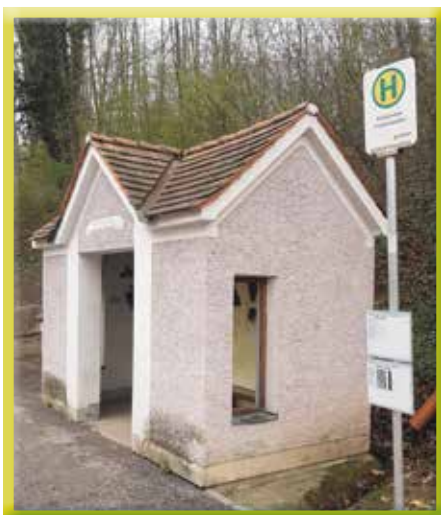
Die alte Busstation am Freiheitsplatz

Eine neue Busstation mit Photovoltaikmodulen, Internet-Hotspot, Gründach und Beleuchtung soll in den Sommermonaten die alte Busstation beim Freiheitsplatz ersetzen.