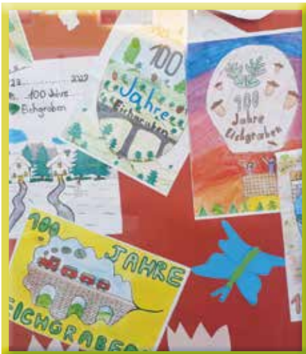
Logoentwürfe zu „100 Jahre Eichgraben“

Auch in die Planung zu den Festivitäten anlässlich des 100. Geburtstags unserer Gemeinde im Jahr 2023, sind die Eichgrabner Vereine ganz eng eingebunden.