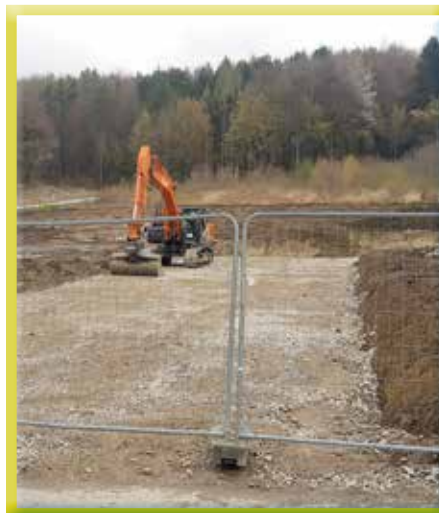
Das Fundament für den Billa wird ausgehoben

Bereits lange angekündigt war der Bau des neuen Billa bei der Ortsausfahrt Richtung Rekawinkel – mit Anfang April haben nun die Bauarbeiten begonnen.