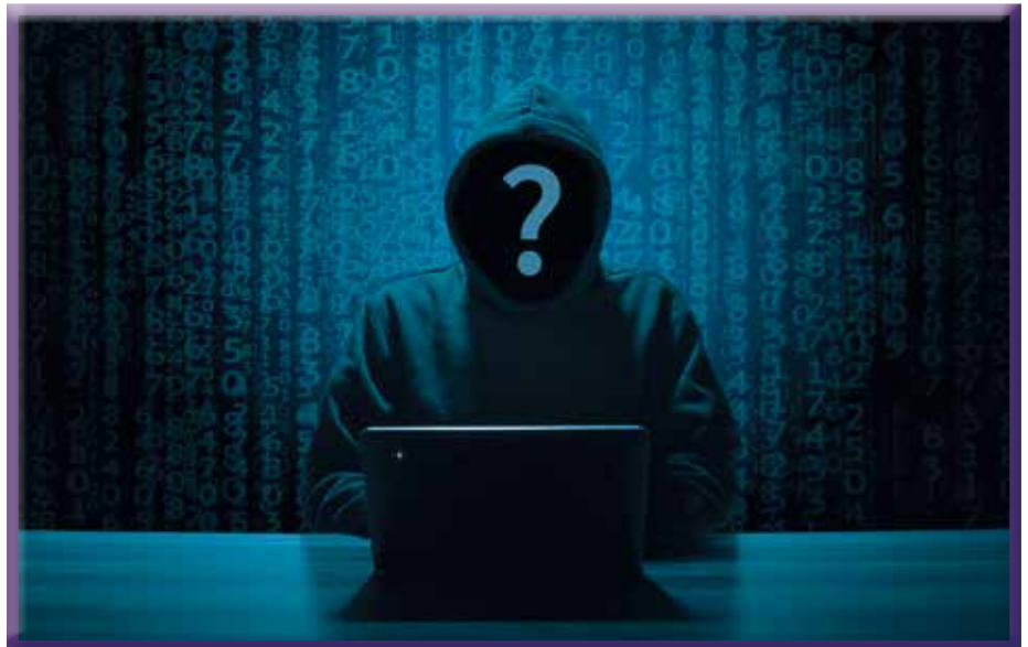
Schützen Sie sich vor Trickbetrügern - geben Sie keine persönlichen Informationen preis