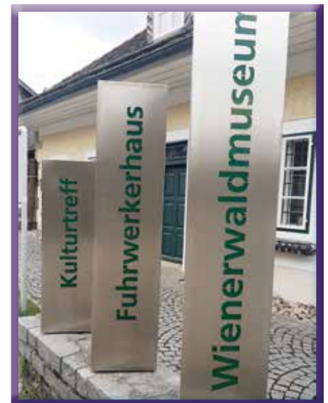
Auch der FVV wird wieder gefördert

Für das 2022 erstmals geschaffene Kulturbudget wurden Richtlinien erarbeitet, um eine gerechte Vergabe zu ermöglichen. Die Förderung soll dazu beitragen, Kulturschaffende und kulturelle Veranstaltungen in Eichgraben zu fördern und das Angebot weiter auszubauen: