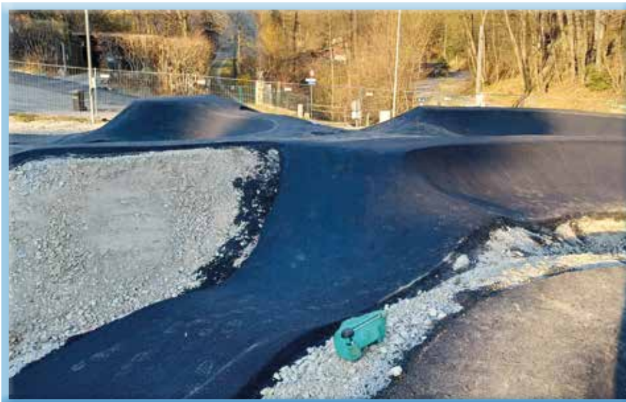
Der Stand der Bauarbeiten Anfang April nährt die Vorfreude vieler Eichgrabner

Fahrrädern, Skateboards, In-Line Skates oder auch Scootern in Betrieb zu nehmen!