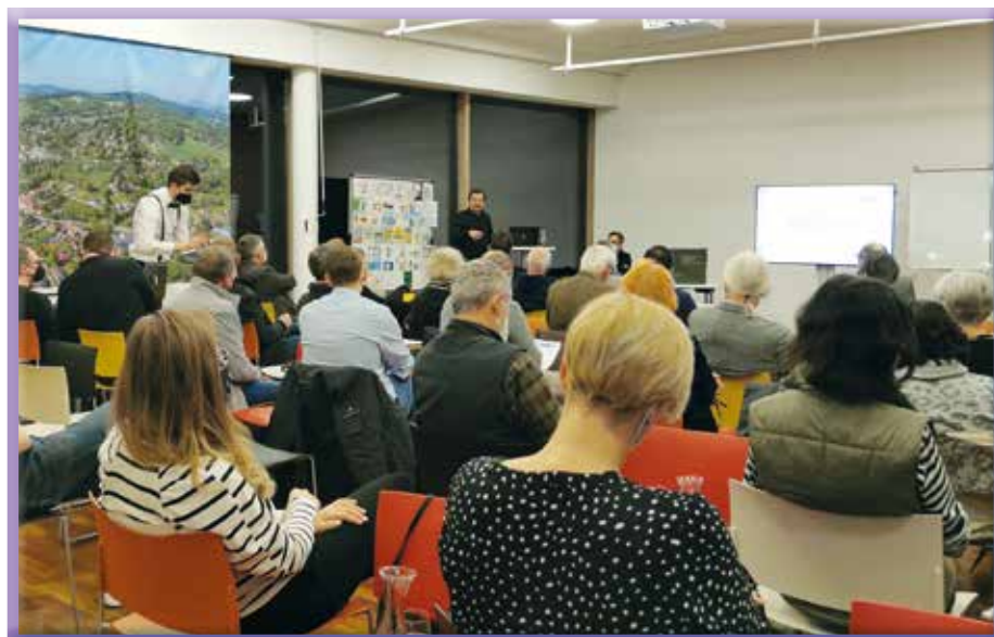
Viele Ideen wurden beim ersten Planungstreffen im Gemeindezentrum ausgetauscht

Vielleicht entdecken Sie dabei sogar ein paar bekannte Gesichter.