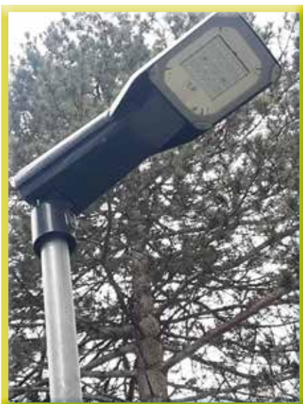
LED-Lampe beim Zugang zur Volksschule

Mit diesem Projekt setzen wir einen weiteren Meilenstein für eine moderne und klimabewusste Gemeinde!