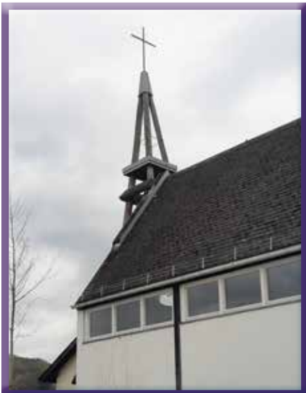
Unterstützung für das Schwesternhaus