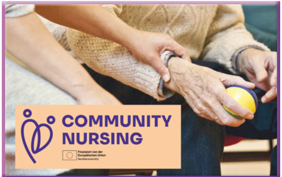
Wir sind auch bei den Community Nurses Vorreitergemeinde

Eine Community Nurse bringt neben der pflegerischen Fachaus-