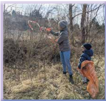
Fam. Montecillo-mit vollem Einsatz dabei