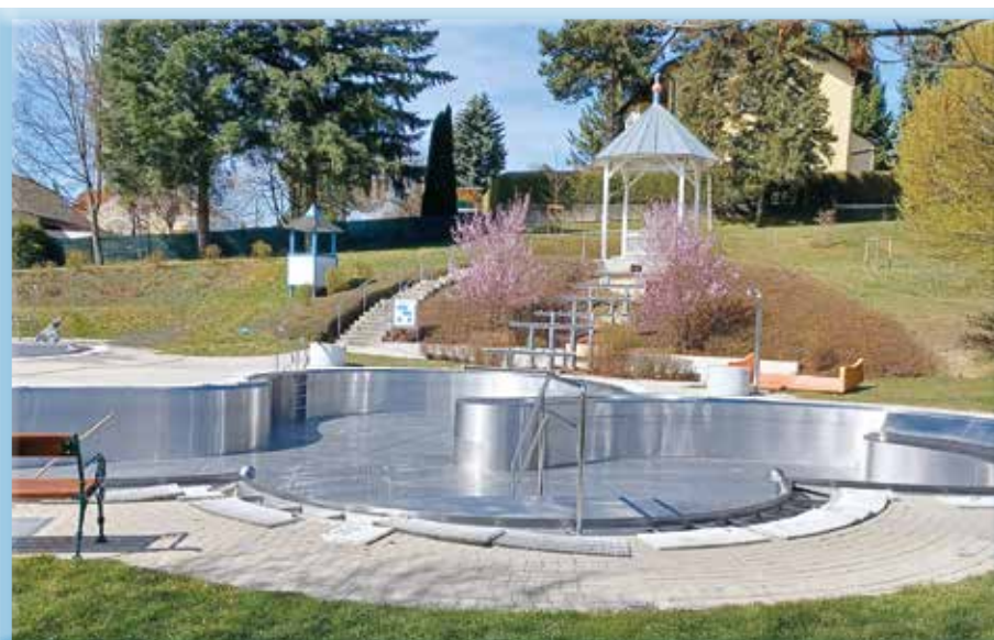
Das Becken ist gereinigt, die Rutsche wird generalsaniert. Bald kann es losgehen.

Gute Neuigkeiten gibt es auch für unsere Frühschwimmer und Frühschwimmerinnen, die heuer wieder mit einer eigenen Frühschwimmer-Saisonkarte (€ 50,-) an vier Tagen in der Woche (Dienstag bis Freitag) von 07:30-09:00 Uhr ihre Längen ziehen können. Alle Saisonkarten sind ab 14. Mai an der Badkassa erhältlich.