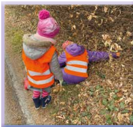
Familie Pfann in Aktion