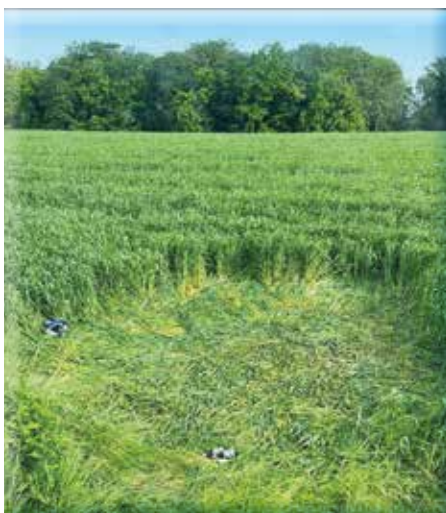
Partynacht mit Folgen

Laut dem NÖ Feldschutzgesetz darf fremdes Feldgut (wie z. B. Äcker, Wiesen, Weiden, Feldfrüchte und auch Vieh auf der Weide) nicht „gebraucht, verunreinigt, beschädigt oder vernichtet“ werden. Übertretungen führen zu empfindlichen Strafen.