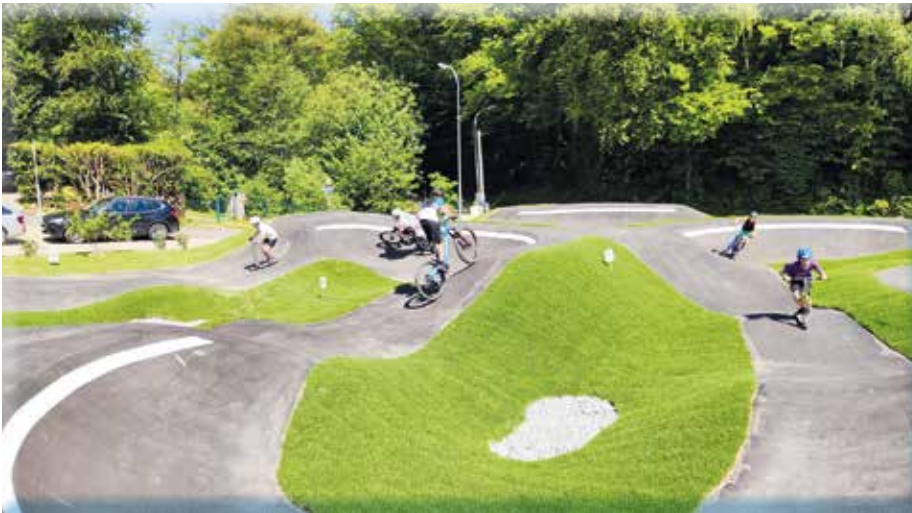
Der Pumptrack - ein moderner Spielplatz für Jung und Alt, Groß und Klein