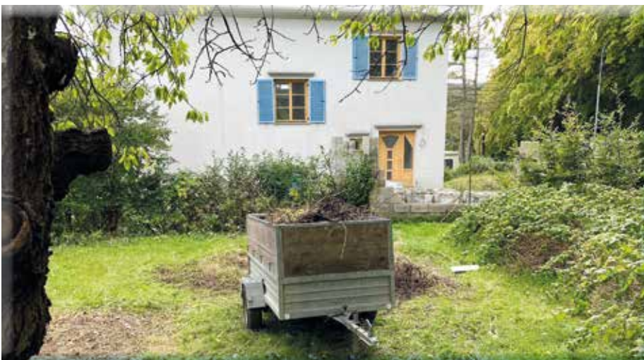
Das Gelände inkludiert auch einen großzügigen Garten und einen Wald in der Nähe.

Die drei Jahre sollen genutzt werden, um eine längerfristige Lösung ausarbeiten zu können.