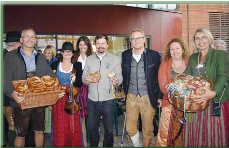
Lebkuchenherzen für die Damen und Laugenbrezeln für die Herren