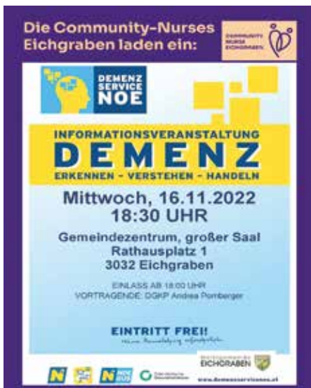
Infoveranstaltung - „Demenz verstehen“

ge ist Demenz – wie erkenne ich Demenz bei mir selbst oder mei-