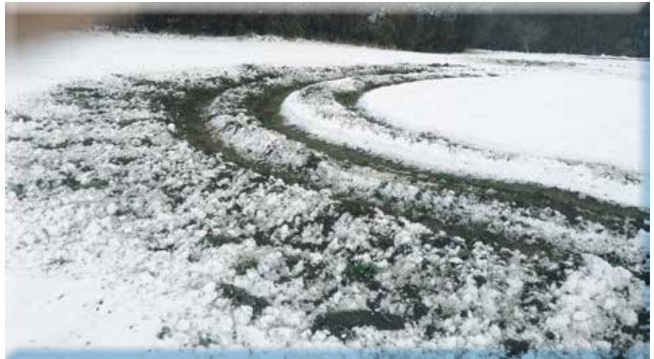
Dank „Probefahrt“ mit Geländewagen wächst hier wohl kein Getreide.

Niedergetretenes Gras verringert die Heuernte und verursacht gro-