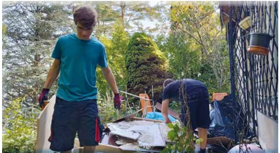
Das neue Haus in der Bergstraße wird von den Pfadfindern vorbereitet.

Dankenswerterweise konnten die Heimabende und Treffen vorübergehend und ohne Unterbrechung im Pfarrheim der Katholischen Kirche abgehalten werden. In regelmäßigen Treffen mit den