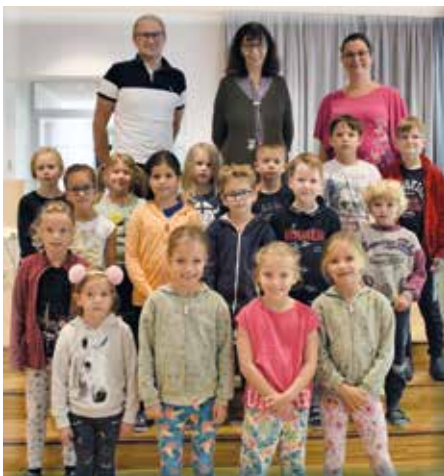
Tafelklassler am Start

Als Gemeinde beschäftigen wir uns sehr intensiv mit dem Thema Blackout. In enger Abstimmung mit unseren Blaulichtorganisationen haben wir einige Vorkehrungen getroffen, um für den Fall der Fälle gerüstet zu sein. Ein wichtiges Thema in diesem Zusammen-