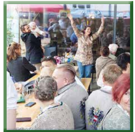
Ausgelassene Stimmung am Kirtag

Der Termin für den Dirndlgwandkirtag nächstes Jahr steht auch schon fest – Streichen Sie sich schon jetzt den 10. September 2023 im Kalender an!