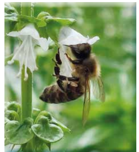
Wir geben den Bienen ein Zuhause

nen wertvollen Beitrag zum Naturschutz leisten und vielleicht auch Sie zum Mitmachen motivieren. „Wilde“ Grünflächen mit duftenden Kräutern, blühenden Hecken und schattenspendenden Bäumen verbessern die Lebensqualität von Mensch und Tier.