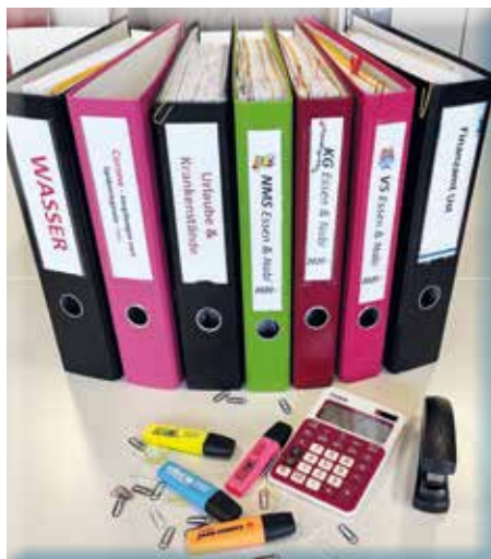
Ein buntes Aufgabenspektrum

Ein hilfsbereiter und entgegenkommender Stil ist mir ein großes Anliegen. Gerade wenn mal etwas nicht so klappt, dann liegt mir der freundliche Umgang besonders am Herzen.“