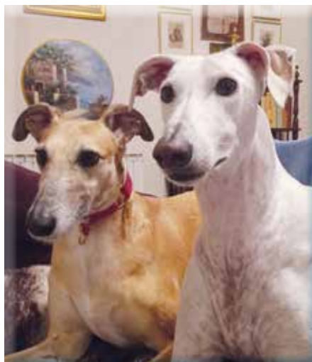
Wir freuen uns schon auf die Hundezone

Aus diesem Grund gilt (jetzt neu) - auch für das Kerngebiet - eine entsprechende Fläche je Parzelle frei von Versiegelung zu halten und als Wiesenfläche auszuführen.