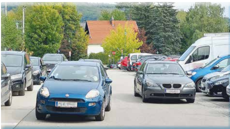
Die P&R Anlage am Bahnhof ist durch Bahnfahrer fast völlig ausgelastet.

Es muss gerade bei den Strecken zur Bahn ein Umdenken erfolgen.