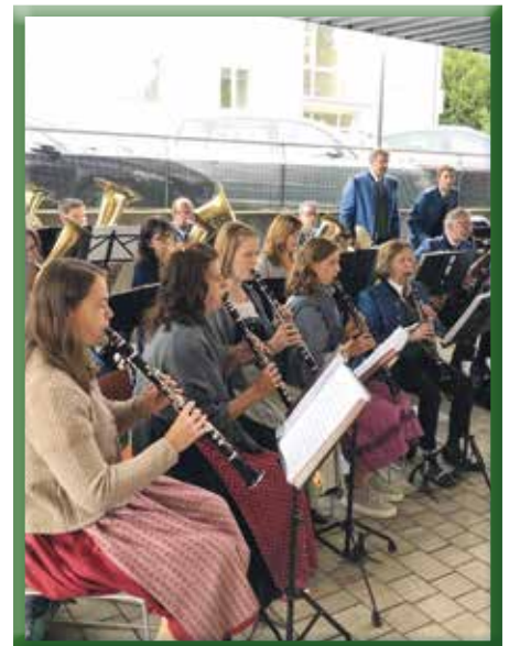
Musikverein zeigte ein großes Repertoire