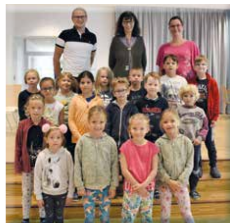
Taferlklassler in Eichgraben