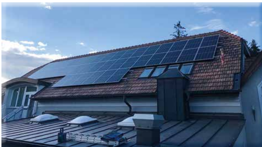
Auch die Gemeinde setzt verstärkt auf erneuerbare Energie, z.B. am Fuhrwerkerhaus

Welcher Energieträger ist zukunftsweisend, wohin führt der Weg bei der Energiewende?