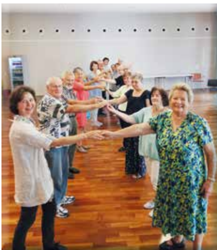
Tanzen hält jung und macht Spaß.

Am 6. September startete die neue Saison mit einem gut besuchten Schnupper-Tanznachmit-