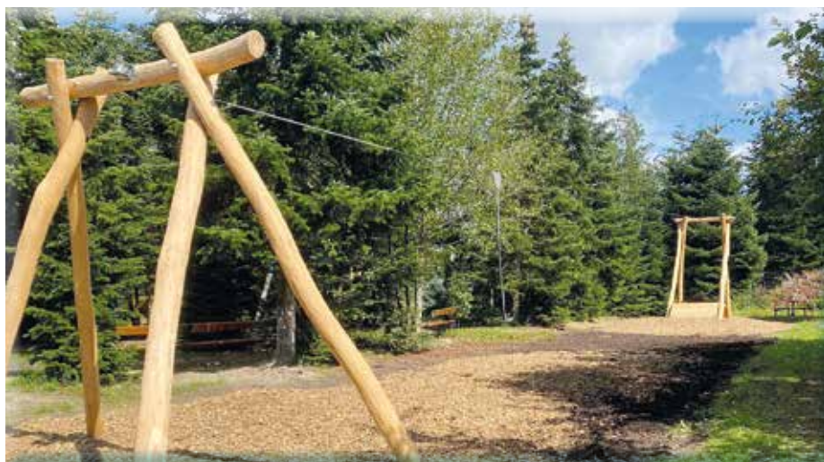
Der Abenteuerspielplatz - ein Ergebnis der letzten Landesaktion NÖ Gemeinde21

In vier thematischen Workshoprunden im Oktober ist die Bevöl-