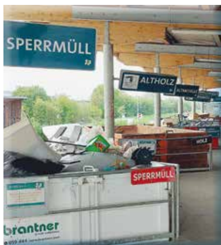
Sortenreines Trennen schont Ressourcen

Also melden Sie sich bis 10. Oktober zur Sperrmüllsammlung an und nutzen Sie diesen Service der Marktgemeinde Eichgraben!