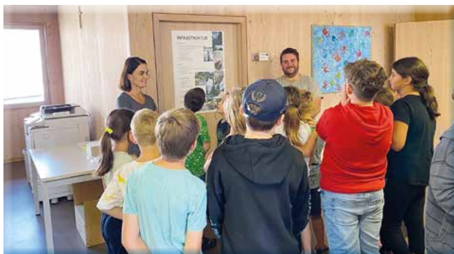
Bürgerbeteiligung beginnt schon im jugendlichen Alter (4. Klasse der Volksschule)

www.noeregional.at/fachbereiche/noe-gemeinde21/