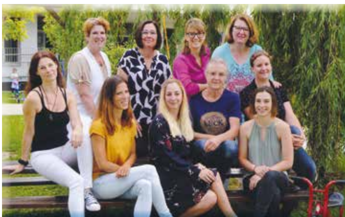
Team der Kindergartenpädagoginnen

Danke für Eure tolle Arbeit und dass ihr die Kinder immer in den Vordergrund stellt!