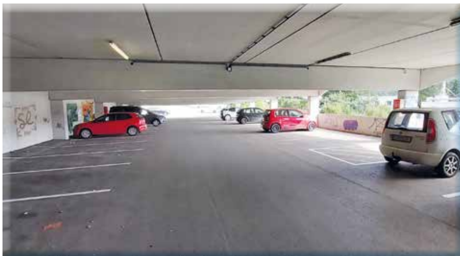
Ein leerer Parkplatz am Wochenende beweist eine widmungskonforme Nutzung.

Nach Abschluss der anberaumten zwölf Monate gibt es eine neuerliche Bewertung der Situation, ob eine videobasierte Überwachung überhaupt einen von den ÖBB erwarteten Effekt erzielen könnte. Wir sind froh, hier eine gute Lösung gefunden zu haben, die ein großes Maß an Flexibilität und Anpassungsfähigkeit erlaubt.