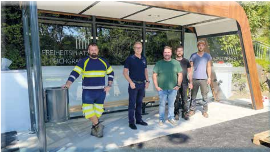
Neues Buswartehäuschen am Freiheitsplatz mit dem Projektteam und Montageteam

Ein wesentlicher Aufgabenbereich der Gemeinde ist der Ausbau und Erhalt unserer Infrastruktur, wie Wasserversorgung, Abwasserentsorgung, Ortsbeleuchtung und Straßenbau. Auch heuer ist hier viel geschehen: