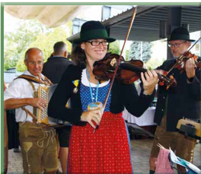
Die Anzbacher Tanzgeiger in ihrem Element