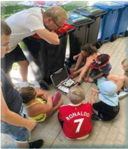
Kinder beim Prüfen der Wasserqualität

Sommerferien - eine schulfreie Zeit für Erholung - endlich Zeit, um Freunde zu treffen, zu spielen und Spaß zu haben. Und der gan-