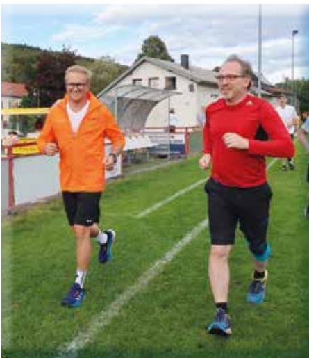
Gemeinde und Feuerwehr beim Benefizlauf

hang ist die Wasserversorgung. In den kommenden Wochen erhalten Sie ein Infoblatt, wo wir über alle wichtigen Maßnahmen und Abläufe informieren. Zusätzlich werden fünf Infopoints im Gemeindegebiet eingerichtet, die im Ernstfall alle zwei Stunden besetzt sein werden, um zu informieren und zu helfen.