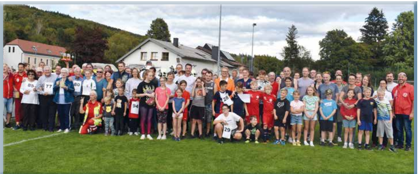
Es gab so viele Teilnehmer am Benefizlauf, dass sie kaum auf ein gemeinsames Foto gepasst haben.