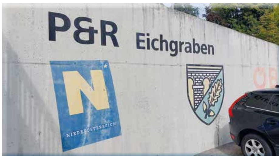
Einigung mit den ÖBB bzgl. der Park & Ride Anlage erzielt

Die nächste Sitzung des Gemeinderates findet am 9. November um 19 Uhr im Gemeindezentrum statt.