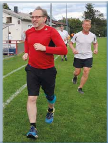
Der eine läuft...