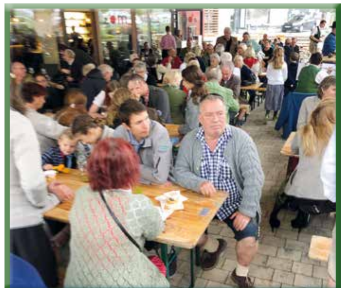
Volles Haus am Dirndlgwandkirtag 2022