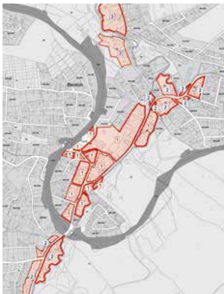
Betroffene Bauland Kerngebietszonen

https://www.eichgraben.at/buerger-service/verordnungen/#139-bau-p1