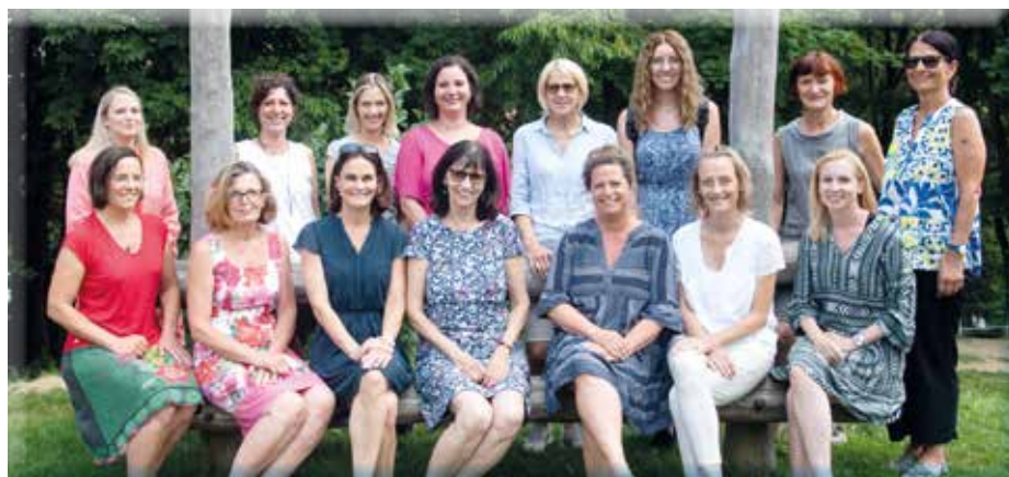
Die Lehrerinnen der Volksschule Eichgraben