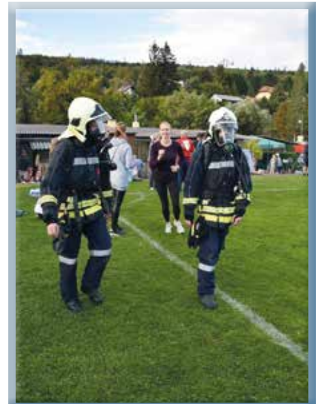
...und der dritte geht für einen guten Zweck.