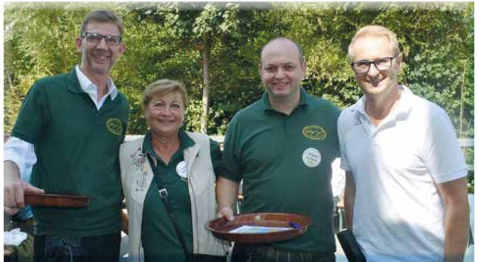
Der Riesenflohmarkt lockte dieses Jahr eine Rekordanzahl von Besuchern an.

Apropos Schulbeginn: Heuer gibt es 3 erste Klassen in der Volksschule und somit insgesamt über 180 Kinder in 9 Klassen. Der Bedarf an Plätzen für die schulische Nachmittagsbetreuung ist - mit derzeit 130 angemeldeten Kindern - weiter gestiegen. Unsere Mittelschule hat eine neue Direktorin und es geht mit frischem Wind ins neue Schuljahr. Einen Schwerpunkt wird heuer dabei die Leseförderung der Schüler darstellen. Es werden Anreize geschaffen, damit die Kinder wieder mehr Freude und Lust bekommen, ein Buch zu lesen. Die Digitalisierung