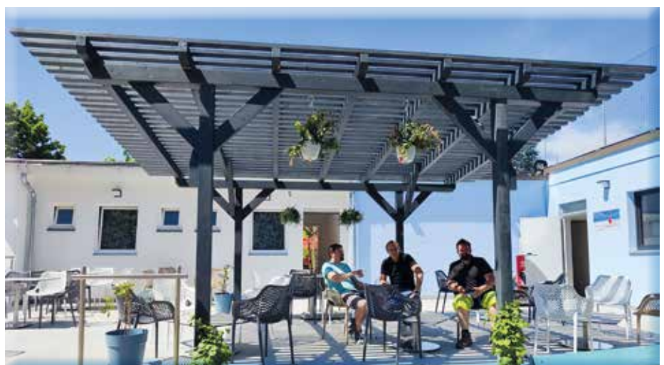
Chill-Out Area am Badvorplatz zwischen Pumptrack und Wienerwaldbad

Zur Freude aller konnte die Rut-sche dann im Mai wieder in Be-trieb genommen werden.