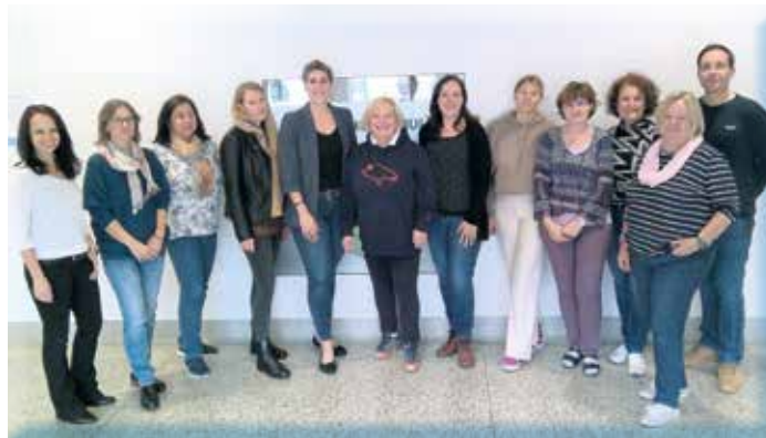
Lehrerkollegium der Mittelschule Eichgraben

Die ersten Wochen im neuen Schuljahr sind nun vorbei – der erste Trubel hat sich gelegt und die Abläufe spielen sich ein.