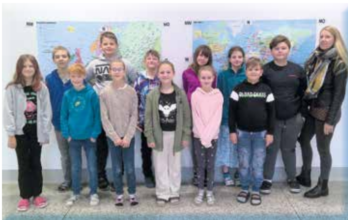
Die neue erste Klasse der Mittelschule