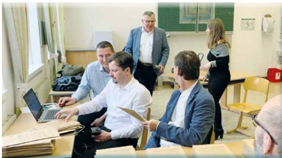
Die Vorbereitungen der Wahlkommission für den 9.10. laufen auf Hochtouren