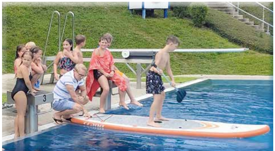
Stand-Up-Paddling ist eine der Hauptattraktionen beim jährlichen Badfest.

Auch im Innenbereich wurde ein Konzept umgesetzt, um auch außerhalb der Badöffnungszeiten