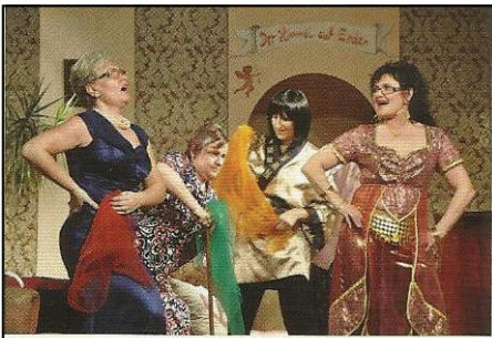
Die Theatergruppe in Aktion

Der Theaterverein hat auch heuer wieder einen erheblichen Anteil seiner Spendengelder einem wohltätigen Zweck zur Verfügung gestellt. Dem Verein „cf-austria“ („Cerebrale fibrose“ = Stoffwechselkrankheit) wurde ein Betrag von € 1.500,- überreicht.