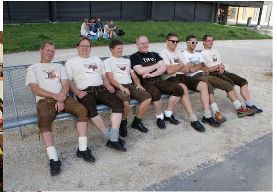
Musikverein - Konzertreise SCHWEIZ bzw. Ausflug BERN