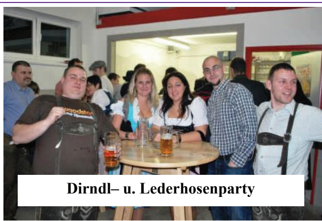
Dirndl- u. Lederhosenparty