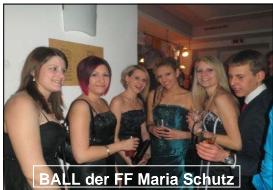
BALL der FF Maria Schutz