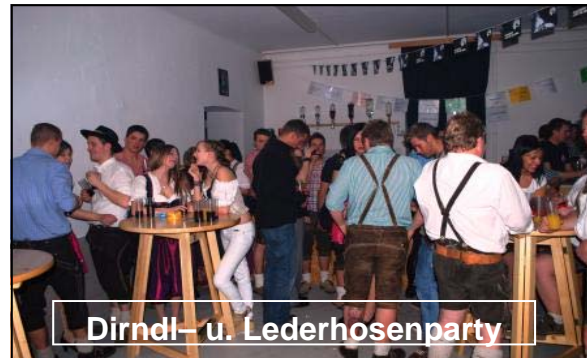
Dirndl- u. Lederhosenparty