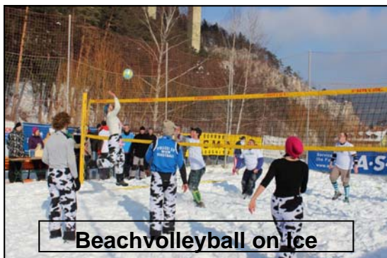
Beachvolleyball on Ice