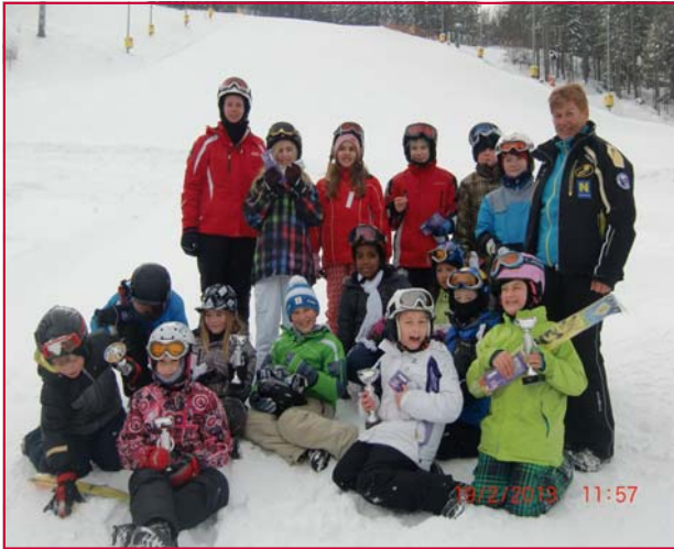
4. Klasse VS-Schottwien