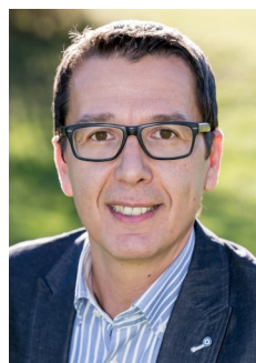
Ihr Bürgermeister Wolfgang Ruzicka