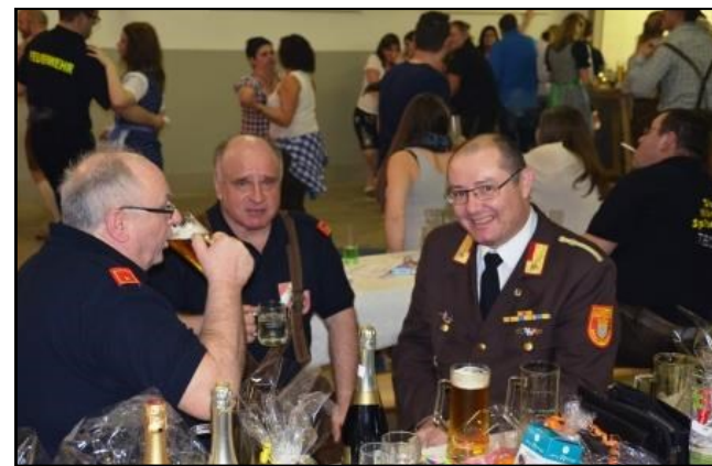
Dirndl- u. Lederhosenparty FF Schottwien