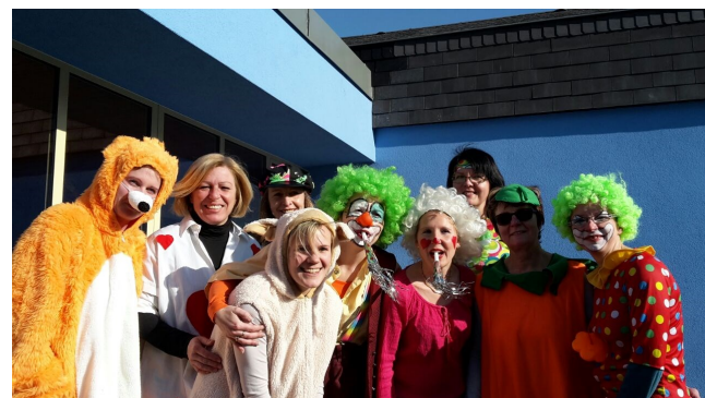
FASCHING in der SCHULE