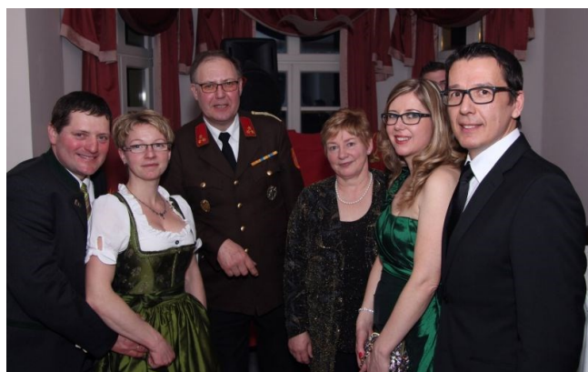
BALL der FF Maria Schutz—Kirchenwirt