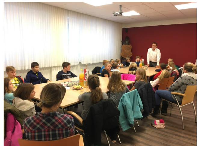
Besuch beim Bürgermeister

Klick—Anschlappen bei der Benützung eines PKW ist Pflicht und erhöht die Sicherheit.