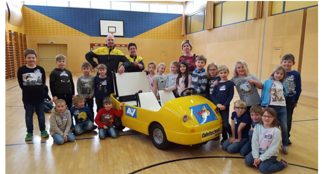
Blick & Klick mit ÖAMTC

Von Vertretern des ÖAMTC wurde eine Sicherheits-schulung in der Volksschule durchgeführt.