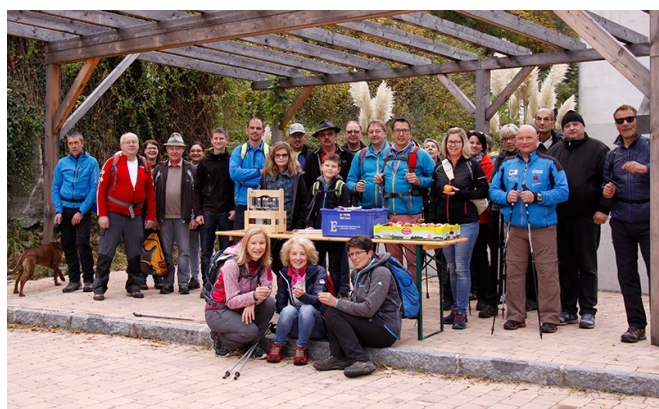
Die Teilnehmer beim Gemeindewandertag