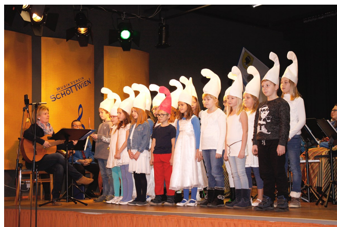
Chor der Volksschule