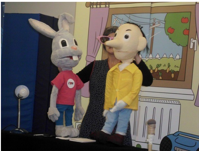
Joulius, der Energiehase zeigte uns den richtigen Umgang mit Strom und erzählte uns woher der Strom kommt. Er brachte auch seine Freunde mit.