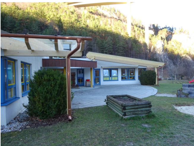
Der Pausenraum im Kindergarten wurde an beiden Hausfronten mit einer neuen Überdachung aus Holz und Glas versehen.