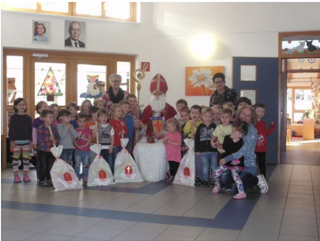
Besuch vom Nikolaus