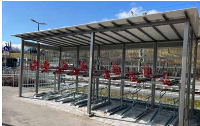
Die neuen Fahrradunterstände bieten Schutz vor negativen Witterungseinflüssen.

zur Senkung der Treibhausgasemissionen leisten. Ihre Programme und Projekte decken ein Spektrum an Klimaschutzaktivitäten ab: Von der Entwicklung langfristiger Strategien, bis hin zu konkreten Hilfestellungen und investiven Fördermaßnahmen. Diese Vielfalt ist Garant für gute Ideen. Die Nationale Klimaschutzinitiative trägt zu einer Verankerung des Klimaschutzes vor Ort bei. Von ihr profitieren Verbraucherinnen und Verbraucher ebenso wie Unternehmen, Kommunen und Bildungseinrichtungen.