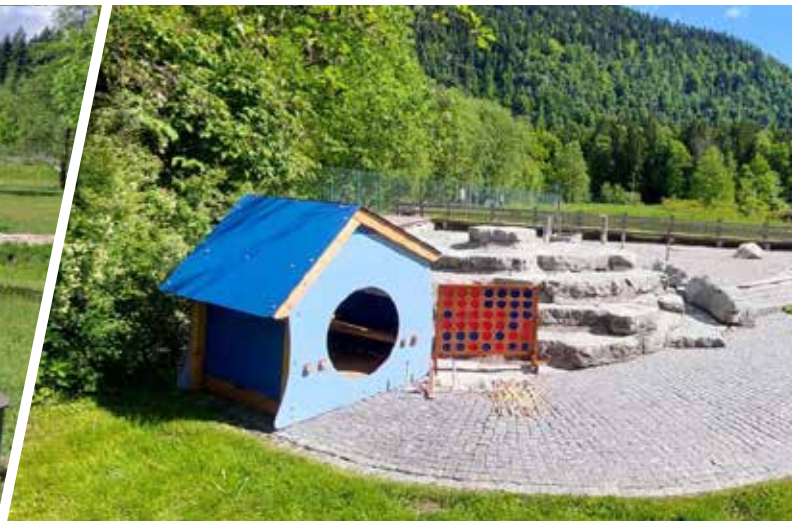
Für unsere kleinen Gäste wurde eine Spielhütte errichtet.

Alle Bürgerinnen und Bürger sind herzlich zum diesjährigen Bier- und Weinfest