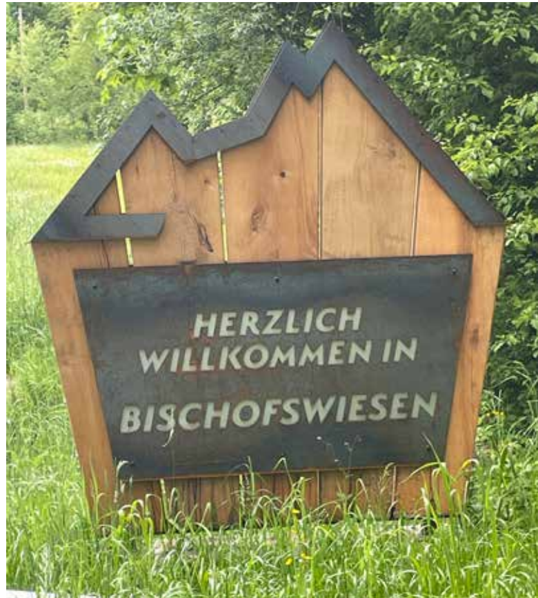
Alle Talkesselgemeinden erhielten neue, einheitliche Ortseingangstafeln.

E-Carsharingangebot und kommen Sie günstig, flexibel und emissionsfrei ans Ziel!