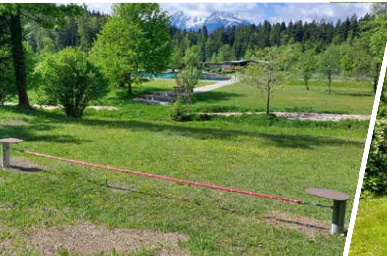
Die neue Slackline für Balance und Geschicklichkeit.

Wir wünschen allen unseren Besuchern entspannte Stunden in beeindruckender Bergkulisse, viel Spaß bei den neuen Attraktionen und unvergessliche Sommermomente für die ganze Familie!