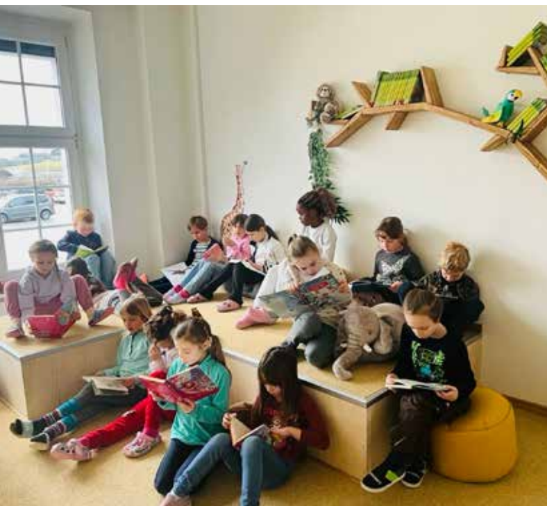
In der neuen Lesewerkstatt können die Kinder in gemütlicher Atmosphäre lesen und entspannen.

Mit großer Freude dürfen wir die Eröffnung der neuen Lesewerkstatt in unserer Grundschule bekannt geben! Kurz vor den Sommerferien des vergangenen Schuljahres organisierte die Grundschule Bischofswiesen zur Finanzierung des Projekts einen Spendenlauf, bei dem von den Kindern sagenhafte 10.620,50 € erlaufen wurden. Für jede 500-Meter-lange Runde, sammelten die Kinder Spenden von Sponsoren, die über die Höhe des Betrags frei entscheiden konnten. Mit den rund 2.300 gelaufenen Runden konnte so dieser stattliche Betrag erreicht werden.