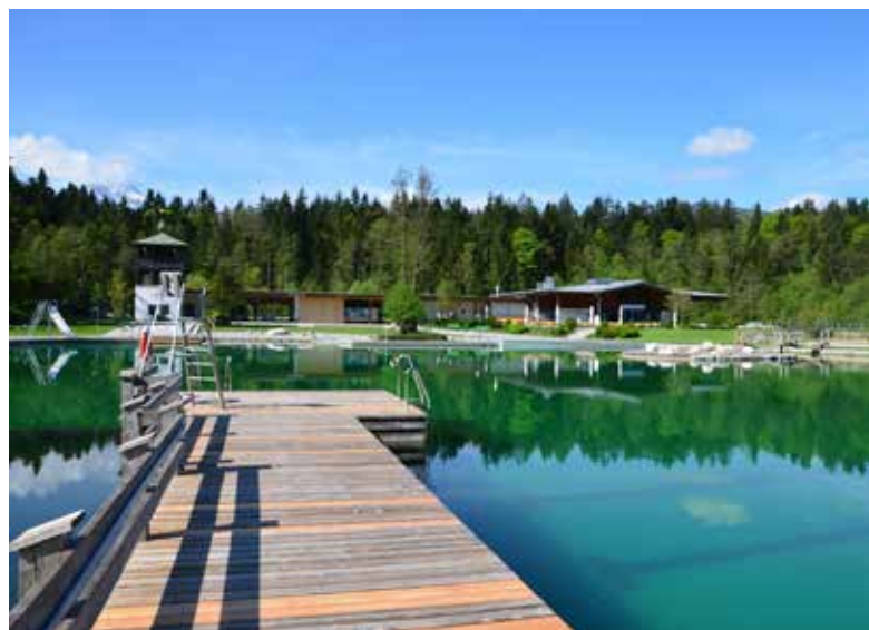
Unser „Aschi“ bietet die perfekte Erfrischung an heißen Sommertagen.

Aktuelle Informationen finden Sie auch auf unserer Homepage: