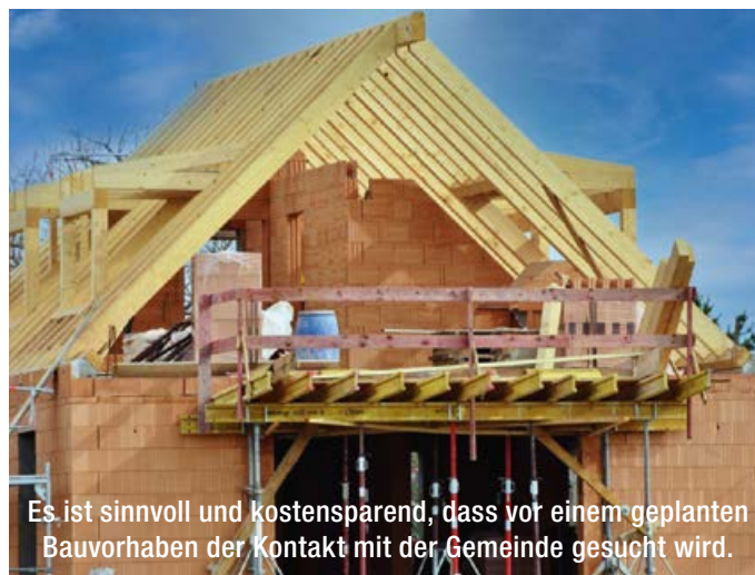
Es ist sinnvoll und kostensparend, dass vor einem geplanten Bauvorhaben der Kontakt mit der Gemeinde gesucht wird.