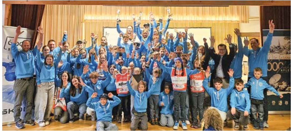
Siegerehrung Bezirkscup „Skibezirk IV“