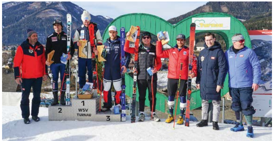
Siegerehrung zweiter Tag Europacup RTL der Herren