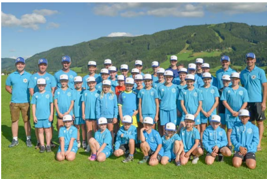
Ein Teil des Nachwuchses und des Trainerteams des WSV Turnau