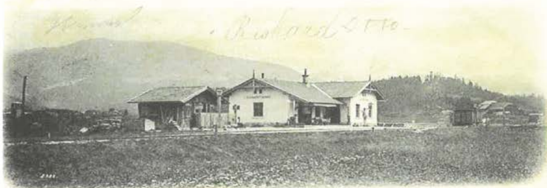
Bahnstation Seebach-Turnau bei Turnau in Obersteiermark Landschaftsbild Südbahn