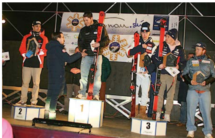
Siegerehrung erster Tag Europacup RTL der Herren