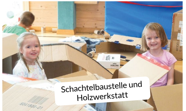
Schachtelbaustelle und Holzwerkstatt