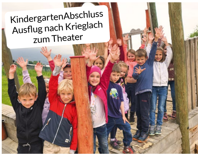
Kindergartenabschluss Ausflug nach Krieglach zum Theater