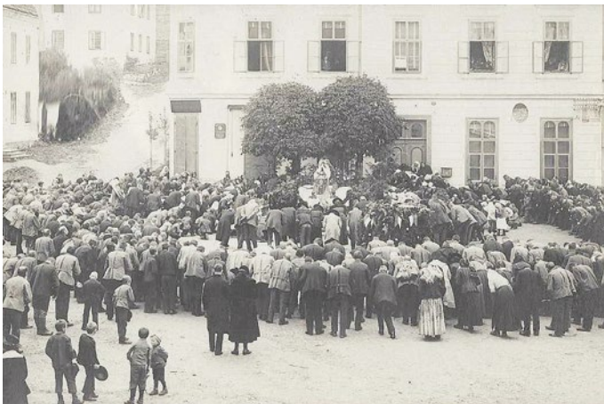
Hl. Messe am Dorfplatz 1920