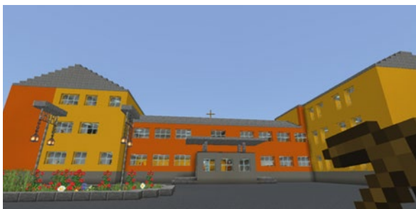
Schülerinnen und Schüler des Schwerpunktfachs „Technik und Informatik“ arbeiteten auch heuer wieder an einem digitalen 3D-Design. Mit viel Geduld und Präzision wurde die Schule bis ins kleinste Detail in Minecraft nachgebaut.