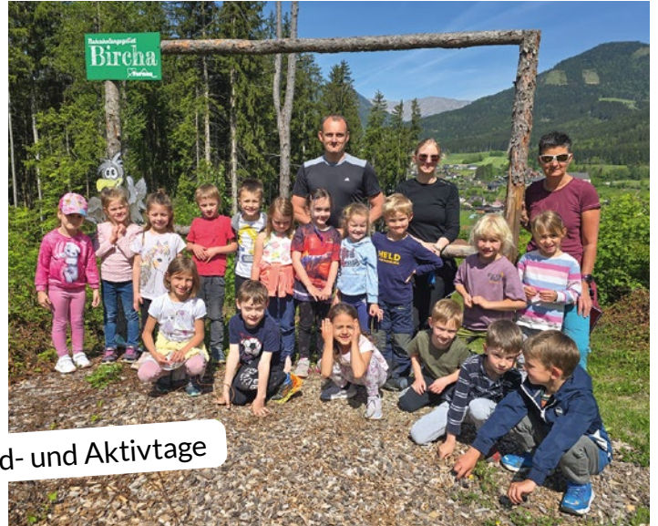
Wald- und Aktivtage