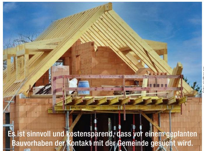
Es ist sinnvoll und kostensparend, dass vor einem geplanten Bauvorhaben der Kontakt mit der Gemeinde gesucht wird.