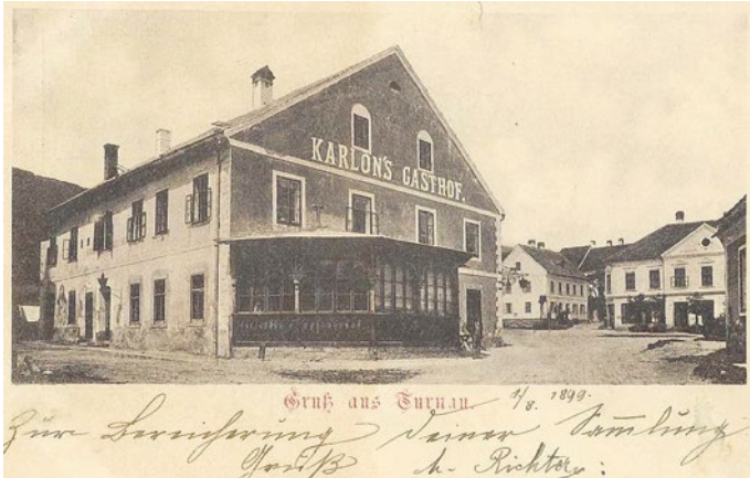
Gasthof Franz Karlon 1899

Auszug aus dem historischen Gemeinearchiv – zusammengestellt von Heribert Haidenhofer