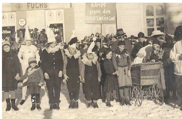
Faschingszug am 7.2.1937 mit dem Motto: „Kampf dem Geburtenrückgang“