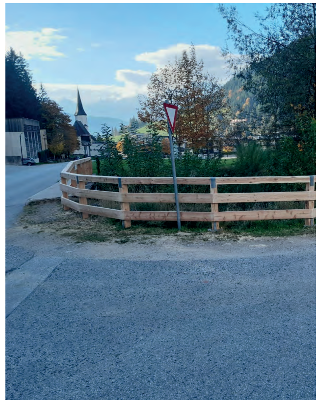
Neue Geländer Höhe Bauhof