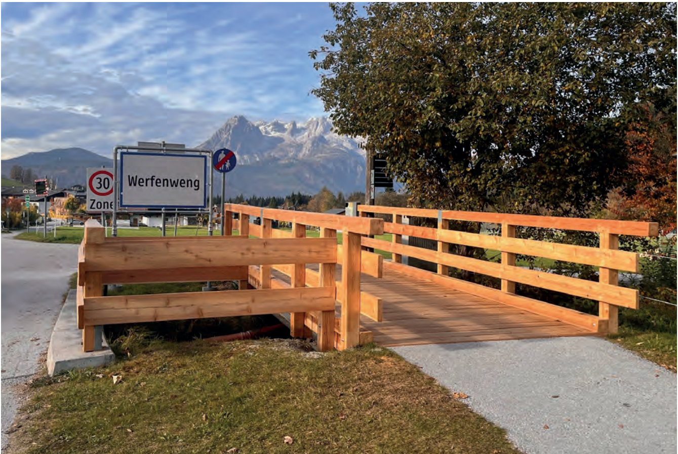
Generalsanierung Brücke in Richtung Wengerau