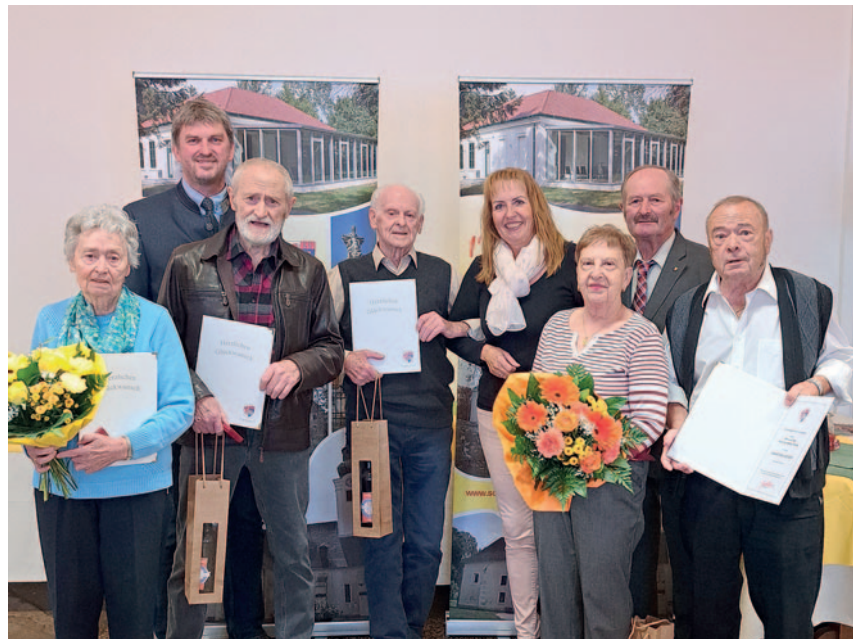
Gruppenfoto aller Jubilare

Nachdem wir in der Vergangenheit bei den Ehejubiläen vermehrt festgestellt haben, dass nicht alle Daten aufliegen, ersuchen wir alle, die 2026 die Goldene, Diamantente, Eiserne oder Steinerner Hochzeit feiern, sich mit Ihrer Heiratsurkunde am Gemeindeamt zu melden.