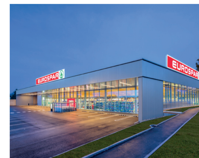
Der EUROSPAR-Markt in Schwadorf besticht durch einen top-modernen Außenauftritt, innovatives Ladendesign und eine große Auswahl an Produkten