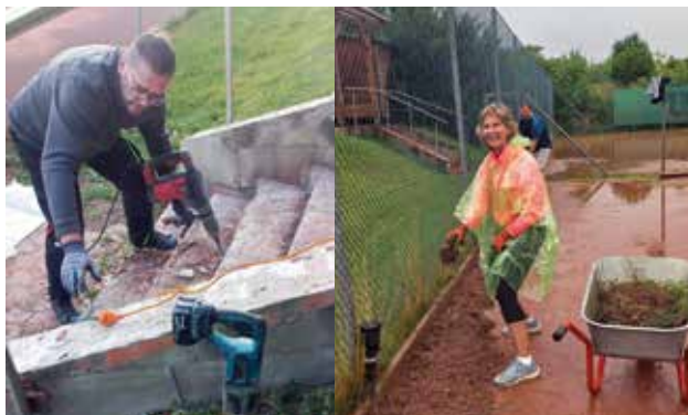
Die Anlage wurde mit vereinten Kräften auf Vordermann gebracht

Der Fitmarsch 2025 endete auf unserer Tennisanlage – ein voller Erfolg! Unsere fleißigen Grillmeister hatten alle Hände voll zu tun und versorgten die Teilnehmenden mit über 150 frisch gegrillten Würsteln. Bei bestem Wetter und großartiger Stimmung freuten wir uns besonders, so viele Ortsansässige bei uns begrüßen zu dürfen. Ein gelungener Tag, der erneut gezeigt hat, wie lebendig unsere Gemeinschaft ist.