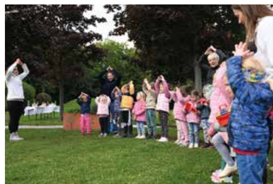
Die Kinder zeigen den Bau ihres neuen Zuhauses

Tagesbetreuung im Kinderhaus Blumau, Kinderhaus Neurißhof, Kindergarten Blumau und Kindergarten Neurißhof Alle Infos erhalten Sie auf den Serviceseiten der Gemeinde und direkt am Gemeindeamt