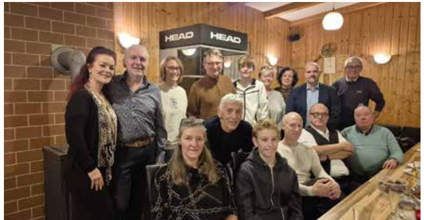
Der TTV-RichOTTO blickt auf eine tolles Jahr zurück

Worüber wir uns alle einig sind und was uns besonders berührt: Wir sind mehr als ein Sportverein. Wir sind ein Ort geworden, an dem man ankommt und sofort spürt, dass man dazugehört. Und so sind Montag und Donnerstag für viele von uns zu kleinen Inseln im Alltag geworden. Egal wie stressig der Tag war – sobald wir die Halle betreten, fällt der Druck ein biss-