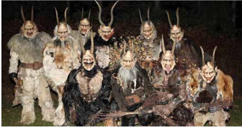
Heimlauf mit Riesenbeteiligung

Ein besonders herzlicher Dank gilt der Gemeinde Blumau, allen voran Bürger-