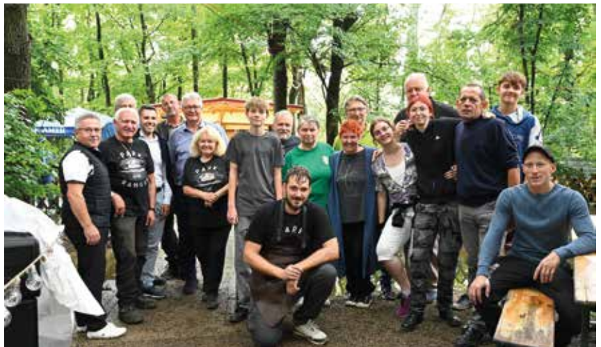
Auch in diesem Jahr freute sich der Verein beim Insselfest über viele Gäste

Auch das Insselfest wurde vom Wetter nicht verschont – und dennoch kamen