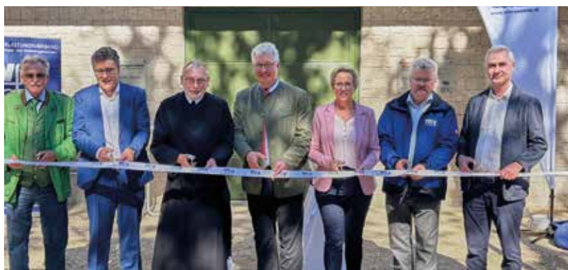
Der neue Hochbehälter am Harzberg wurde mit vereinten Kräften finanziert und gemeinsam eröffnet

Im September wurden zur Sicherung der Wasserversorgung, durch zwei neue Trinkwasserbehälter in Bad Vöslau eröffnet. Der außer Betrieb genommene 1950 erbaute Hochbehälter mit einem Volumen von 5.000 m 3 wurde revitalisiert und wieder ins Versorgungsnetz eingebunden. Bei der Revitalisierung wurde der neue Behälter in den alten Hochbehälter am selben Standort hineingebaut, um keine weiteren Waldflächen verbauen zu müssen. Gesamtkosten 1.900.000 € Der bestehende Ortsbehälter Bad Vöslau, erbaut 1930 mit einem Behältervolumen von 500 m 3 , hatte Bauschäden und war speichertechnisch nicht mehr ausreichend. Deshalb wurde er abgerissen und im unmittelbaren Nahbereich ein