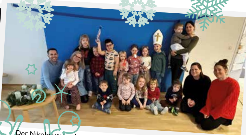
Der Nikolo verzauberte auch die Kinder im Kindergarten Blumau in Form von süßer Schokolade