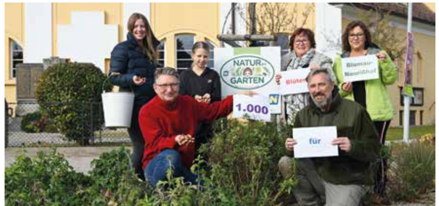
Rege Beteiligung herrschte an der Pflanzaktion in beiden Ortsteilen.