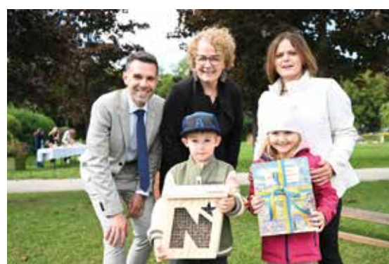
Ein Nützlingshotel für den Garten von der Landesrätin