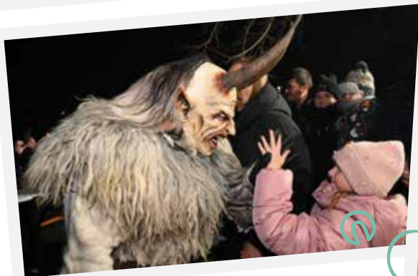
Die PUL sorgte auch heuer wieder für den Besuch vom Nikolo und einen schaurigen Auftritt von Krampus und seinen pulverteuflichen Gesellen.