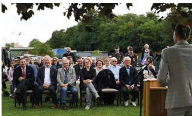
Bürgermeister René Klimes schaute zurück und erklärte, warum ihm der Neubau so wichtig ist

Doch zurück zum Beginn des Bauvorhabens, das auf einer Fläche von 250m 2 nicht nur einen Gruppenraum mit Ruhezone, Büro, Personalraum, Küche und alle erforderlichen Nebenräume ermöglicht, sondern auch ein Pelletsheizwerk, das den Kindergarten, den Bauhof und die Tierarztpraxis versorgt. „Ein Vorzeigeprojekt“, wie auch Landesrätin Christiane Teschl-Hofmeister betont, die die Betreuung der Kinder und Senioren auch in budgetär schwierigen Zeiten als Kernaufgaben der Gemeinden nennt.