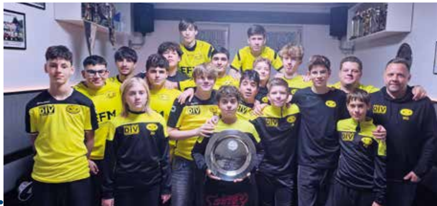
Unsere U16 Gruppensieger

Ein großes Dankeschön gilt auch allen Fans, die unsere Jugend- und Erwachsenenteams bei den zahlreichen Heimspielen Woche für Woche unterstützen.