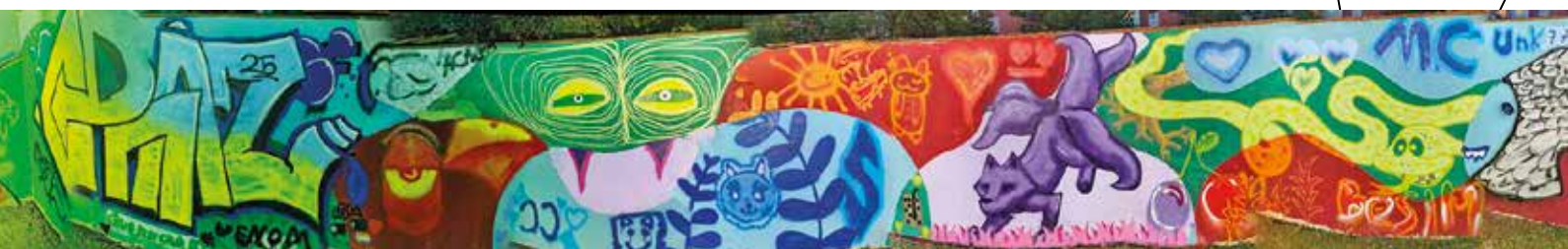
Eine coole Wand entstand in Leobersdorf

Kurz vor dem Winterbeginn gibt es wie gewohnt das nächste Update der Mobilen Jugendarbeit TANDEM. In der Region ist viel passiert: