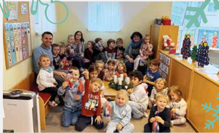
Über Schokolade-Nikolos freuten sich die Kleinsten im Kindergarten Neurßhof