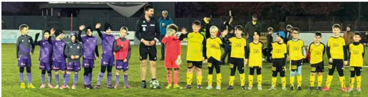
Unsere U10 im Spiel gegen FK Austria Wien

Unsere insgesamt 10 Nachwuchsmannschaften können auf eine sehr erfolgreiche Herbstsaison zurückblicken. Besonders erfreulich ist, dass bereits mehrere junge Talente ihre ersten Einsätze im Erwachsenenfußball gefeiert haben. Hier ein kurzer Überblick: