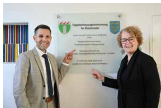
Gemeinschaftsprojekt zum Kinderwohl