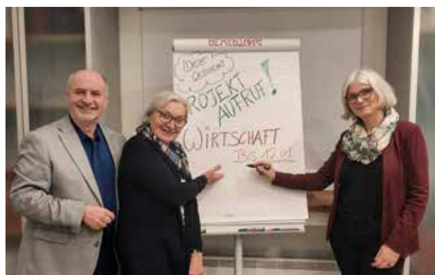
Bis 12. Jänner 2026 können Ideen direkt eingereicht werden

gionale Wirtschaft eröffnet werden können. Abschließend wurde der aktuelle Förderaufruf der LEADER-Region mit einem humorvollen Einstiegsvideo präsentiert.