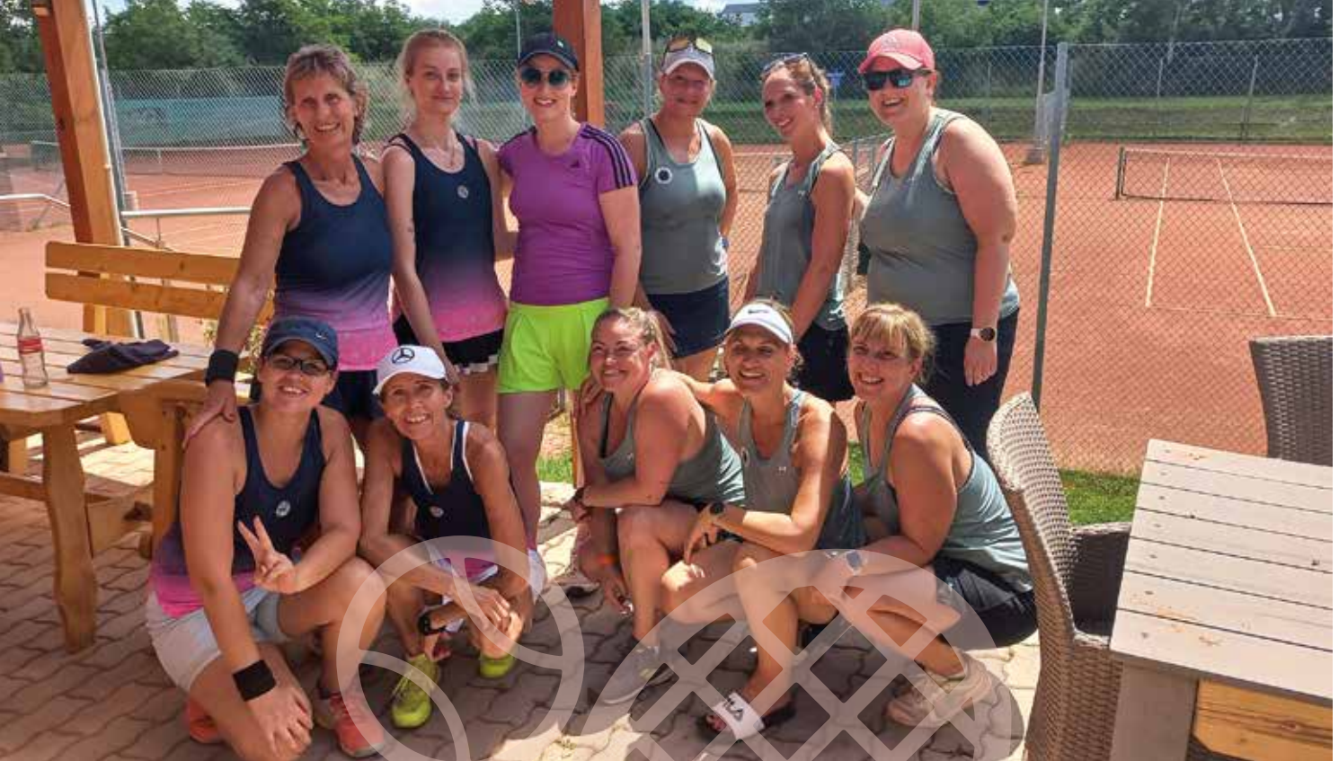
Der Tennisclub Blumau-Neurißhof freut sich über ein abwechslungsreiches Vereinsjahr mit vielen Highlights