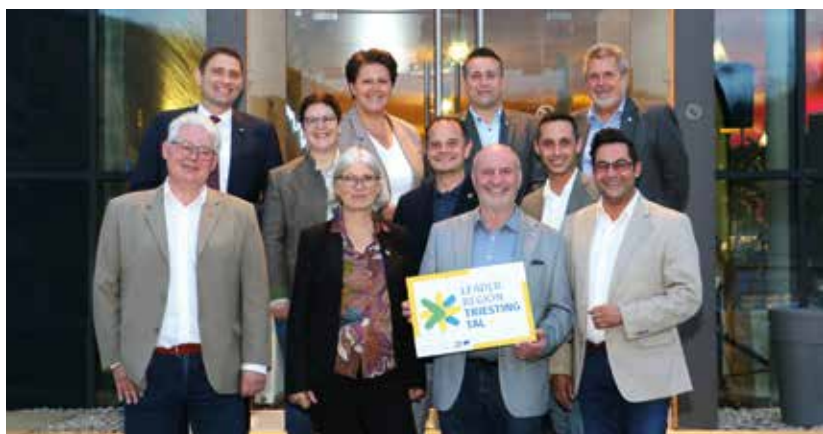
Gemeinsam wurde in der LEADER-Region ein neuer Schwerpunkt gesetzt