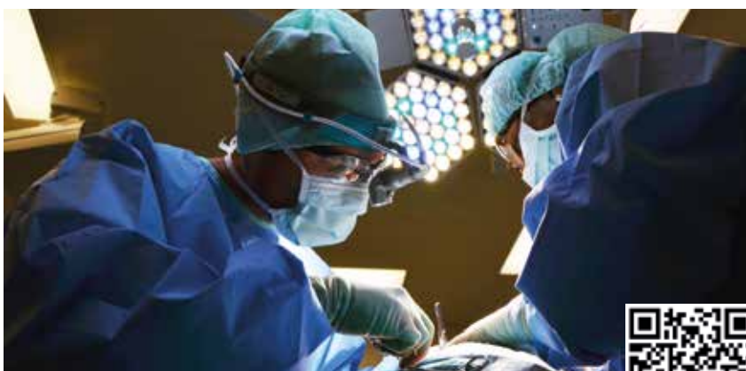
Eine Neuaufstellung des Gesundheitssystems in NÖ sorgt für Sicherheit

Aufgrund des europaweiten Mangels an Pflegekräften und Medizinerinnen wird auch die Situation in Österreich weiter herausfordernd bleiben. Ein zukunftsfitte Gesundheitssystem muss das darin arbeitende Personal bestmöglich schützen, unterstützen und vor allem gezielt einsetzen. Aufgrund der anstehenden Pensionierung von gebur-