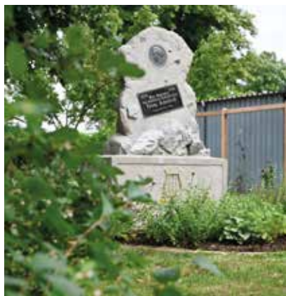
Das Schubertdenkmal erstrahlt im neuen Glanz