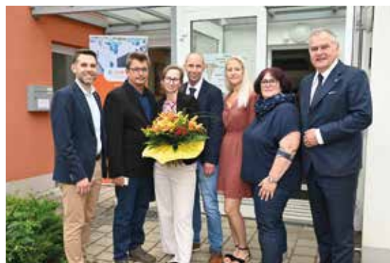
Die SGN unterstützte die Adaptierungsarbeiten