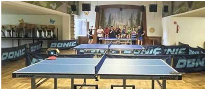
Zu Tischtennis in angenehmer Atmosphäre lädt der Tischtennisverein Blumau-Neurißhof ein

Am Tisch zählt der Mensch nicht das Alter. Die Jüngeren lernen von der Erfahrung der Älteren, die Älteren lassen sich gerne von der Schnelligkeit und dem Ehrgeiz der Jüngeren inspirieren.