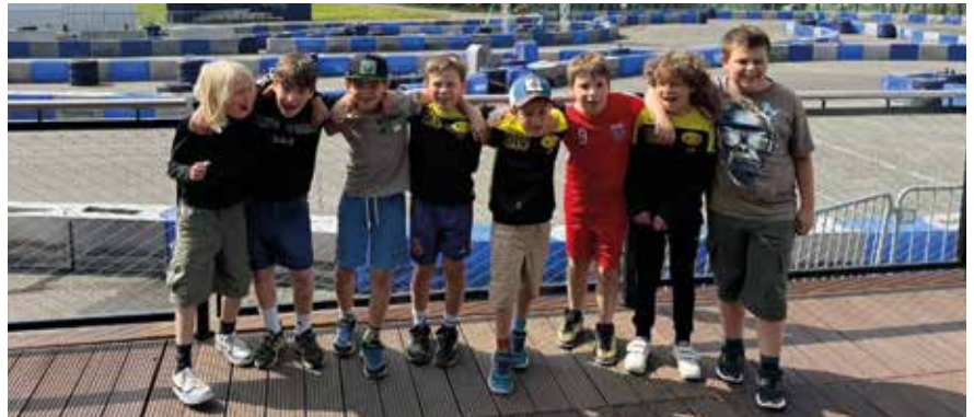
Unsere U9 nach einem Turnier in Judenburg (Zirbenlandcup) ...