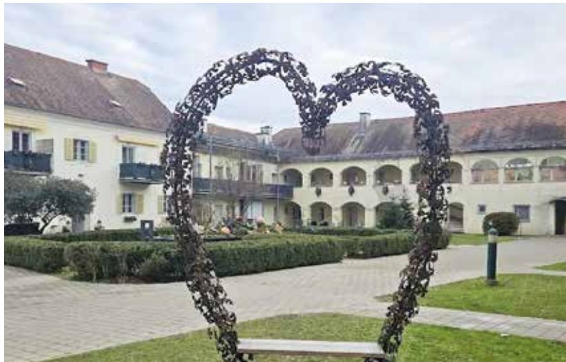
Das Schloss Burgau ist allemal eine Reise in die Steiermark wert.