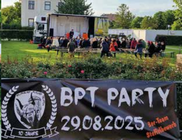
Lastkrafttheater und Ankündigung zum 10-Jahresfest