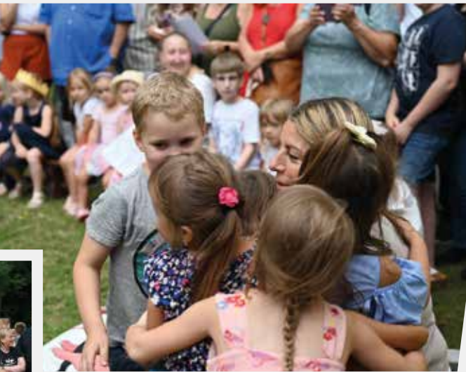
Noch einmal feste drücken vor dem Pensionsantritt