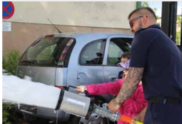
Auch ein Löschangriff will richtig erlernt werden – wie genau das geht, erfuhren die Schülerinnen und Schüler bei „Gemeinsam.Sicher.Feuerwehr.“

Am 2. August, 6. September und 4. Oktober laden wir jeweils ab 16 Uhr zum gemütlichen Beisammensein bei der Hütte vom Feuerwehrhaus. Dies sind ideale Gelegenheiten, um die Mitglieder und das Kommando der FF Blumau kennenzulernen – vielleicht ergibt sich ja auch dadurch eine neue Mitgliedschaft.