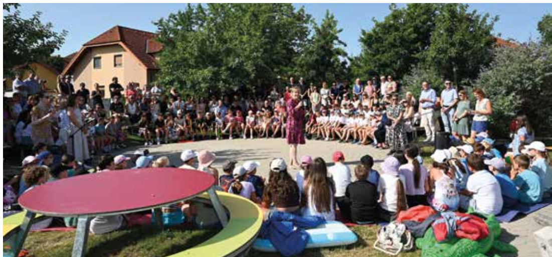
Eine sehr herzliche Verabschiedung fand mit schwungvollen Liedern und Tänzen in der Volksschule Teesdorf statt.