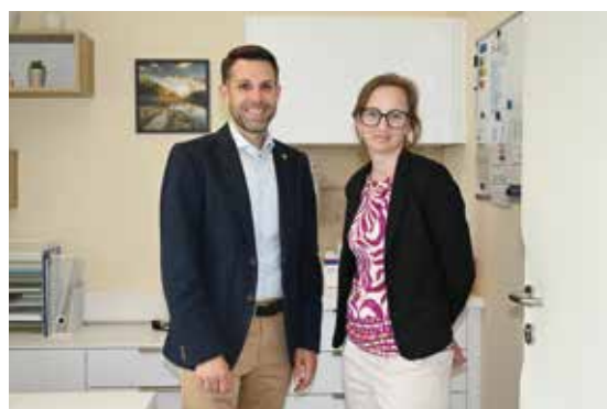
Herzlich willkommen in perfekt adaptierten Räumlichkeiten.