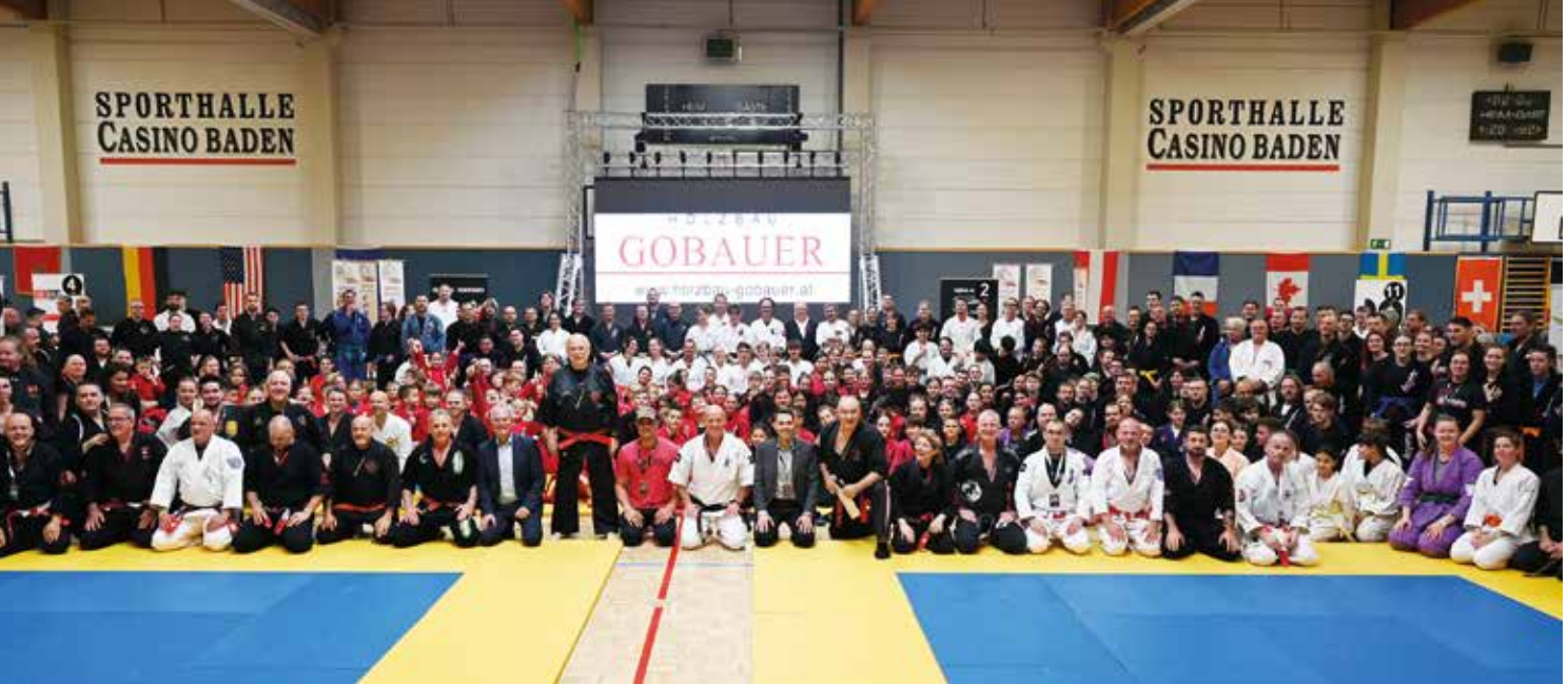
Das internationale WORLDKOBUDO HAJIME FESTIVAL in Baden.