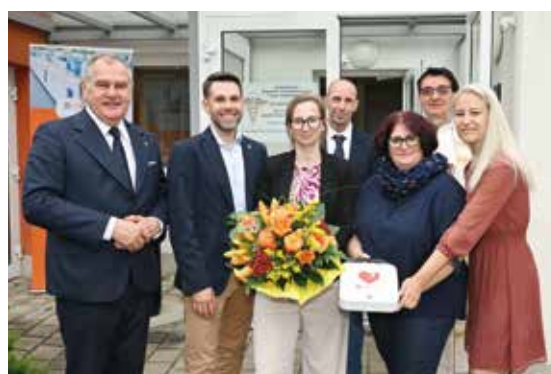
Einen Defibrillator gabs zur Eröffnung als Geschenk