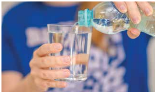
Richtig trinken für den Wasserhaushalt

Um den täglichen Flüssigkeitsverlust auszugleichen, ist regelmäßiges Trinken unumgänglich. Durch das Schwitzen werden wichtige Mineralstoffe ausgeschieden, welche wieder rasch ersetzt werden sollten. Dabei helfen Getränke, deren Inhaltsstoffe [Mineralstoffe] schnell in den Blutkreislauf gelangen. Ein solches isotonisches Getränk kann man einfach selbst herstellen: naturbelassenen Apfelsaft 1:1 oder 1:2 mit Wasser oder Mineralwasser spritzen. Geeignete Getränke sind aber auch kalte Früchte- und Kräutertees oder verdünnte Gemüsesäfte. Lauwarmer Pfefferminz-, Salbei-, Holunderblüten- oder Zitronenmelissen-Tee kühlt wirksamer als Softdrinks mit Eiswürfel. Am besten erfrischen Getränke mit einer Temperatur knapp unterhalb der Zimmertemperatur.