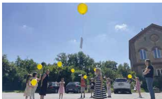
Mit dem Schultaschentag feierten wir „Rauskehren“