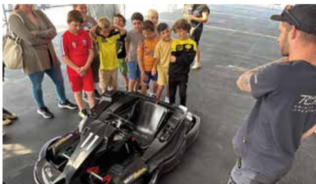
... beim Teambuilding am Red Bull Ring in der Steiermark.

ASK „100er Club“: Der Club 100 für die Saison 2025/2026 startet Mitte August (gültig bis Juli 2026). Wir würden uns