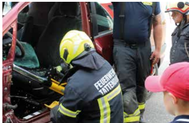
Menschenrettungen stehen bei technischen Einsätzen vielfach im Vordergrund