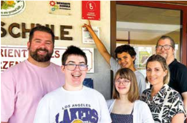
Unsere Schule erhält erstmals das BBO-Gütesiegel!

Im Berufsförderungszentrum freut man sich sehr, dass die Schule heuer erstmals mit dem BBO-Gütesiegel der WKNÖ