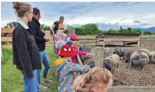
In den Minizoo nach Tattendorf führte unser Ausflug

Einige Tage später fand der „Schultaschentag“ und das „Rauskehren“ der Kinder im verpflichtenden Kindergartenjahr statt, bei dem wir auch Luftballons mit guten Wünschen stiegen ließen.