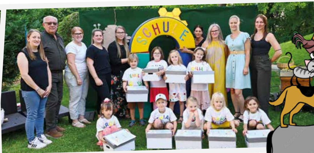
Und nun geht's auf in die Ferien und danach für uns in die Schule!