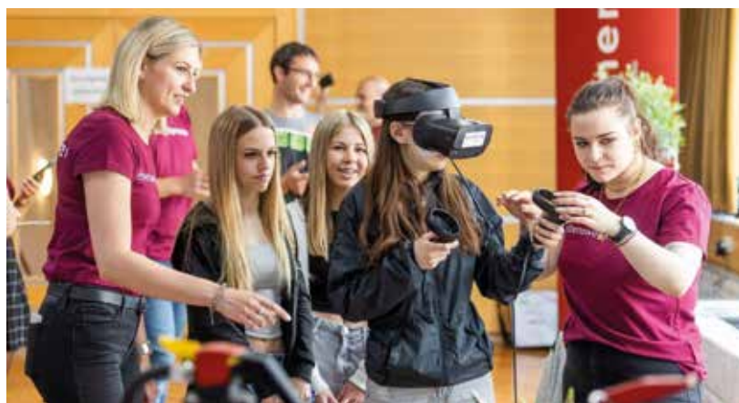
Die VR-Brille am Stand von kosaplaner war sehr beliebt

Mit über 400 Jugendlichen, einem abwechslungsreichem Vortragsprogramm, einer stimmungsvollen Eröffnung und mehr als 40 Ausstellern aus dem Triestingtal hat die Regionalmesse „Zukunft anpacken“ im Kulturhaus Hirtenberg eindrucksvoll gezeigt, wie engagiert und ideenreich eine Region auftreten kann, wenn Gemeinden, Betriebe und Menschen gemeinsam anpacken. Technik zum Angreifen, Berufsbilder im Wandel und Gespräche auf Augenhöhe machten die Messe an beiden Tagen zum lebendigen Schaufenster für regionale Stärke und Zukunftschancen. Am Freitagvormittag stand die Jugend im Fokus: Über 400 Schüler:innen aus der Region kamen, um Berufe zu entdecken und Zukunft zu erleben. Mit einem „Aktivpass“ ging es durch 17 interaktive Stationen, die von den Betrieben mit viel Kreativität gestaltet wurden. Aktiv- und Quizstationen sorgten für Aha-Erlebnisse – der Stempelpass konnte gegen ein Goodie-Bag der LEADER-Region getauscht werden.