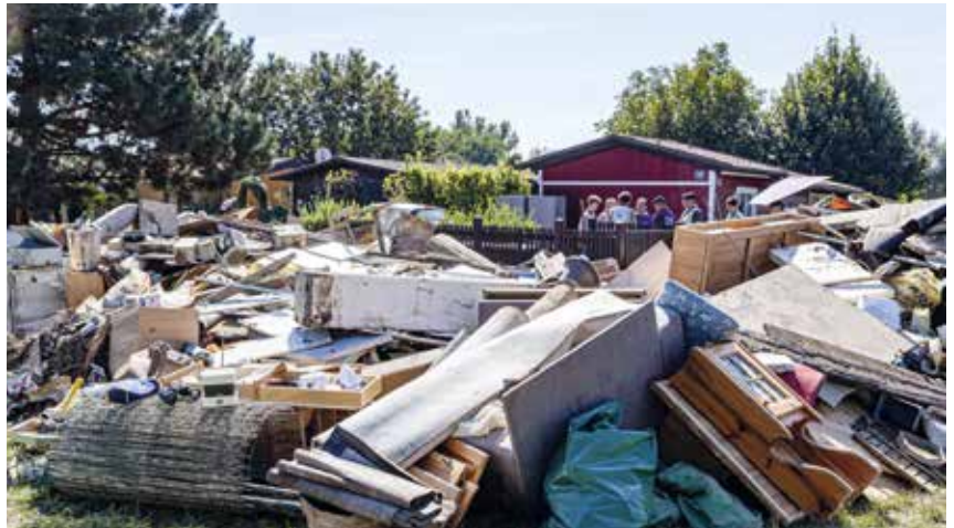
Einander zu helfen, wenn nichts mehr geht: Füreinander Niederösterreich

Du brauchst keine besondere Ausbildung. Jede Unterstützung ist