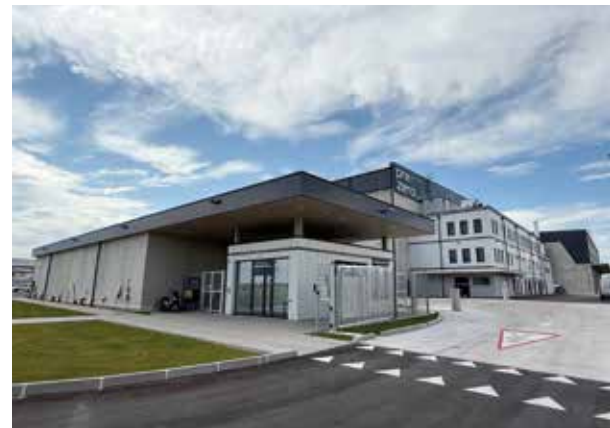
PreZero Wertstoffsortieranlage in Sollenau

Es ist somit durch die geplante Betriebsanlage nicht von erheblichen, belästigenden bzw. belastenden Auswirkungen (gemäß den gewählten Immissionspunkten) auf die Umwelt zu rechnen.