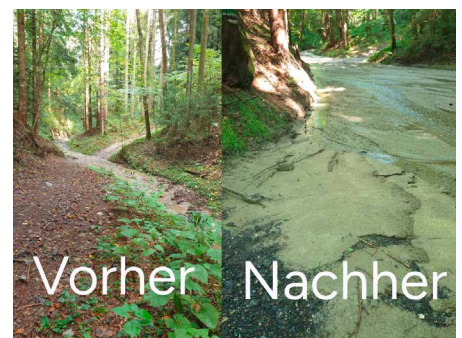
Kleinrückhaltebecken Hochneukirchen, Kirchsschlag und Ransgraben