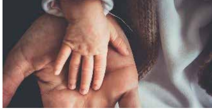
Abbildung: Ab welchem Alter geben wir die Obhut unserer Kinder bedenkenlos in andere Hände?

Kleinkinder unter 3 Jahren sind in gewissen essentiellen Bereichen der Außenwelt ohne den mütterlichen / väterlichen Schutz quasi auch schutzlos ausgeliefert. Selbst bestens ausgebildete Pädagog:innen sind mit dieser alltäglichen Herkulesaufgabe, gleichzeitig bis zu 15 Kleinkinder betreuen zu müssen, oftmals heillos überfor-