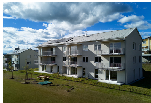
ÖWG Wohnhaus Nummer 3

Wir hoffen, dass sich die neuen Mieter in der Bahnhofsiedlung wohl fühlen. Außerdem freut es uns sehr, dass aufgrund der großen Nachfrage bereits einen Tag vor den Wohnungsübergaben