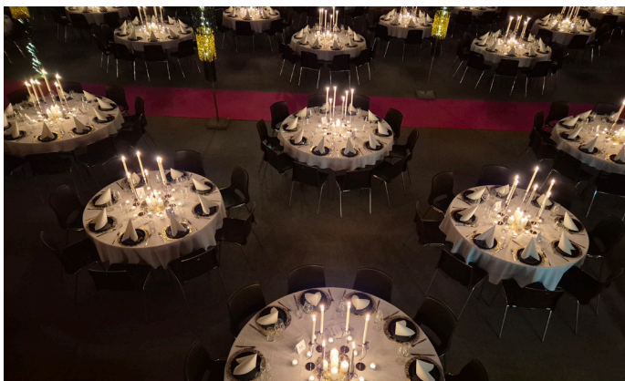
Gemeindeball 2025 und Eröffnung Adventmarkt 2025