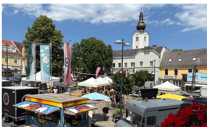
Street Food Market und Sommerkino