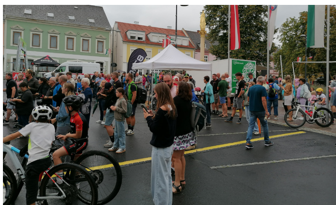
Intern. Radjugendtour – Zielankunft am Hauptplatz