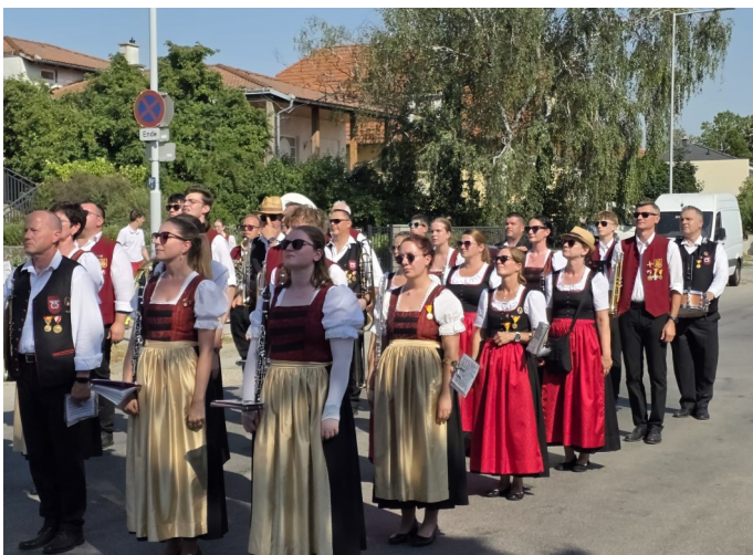
Musikverein bei Bezirksmarschwertung 2026