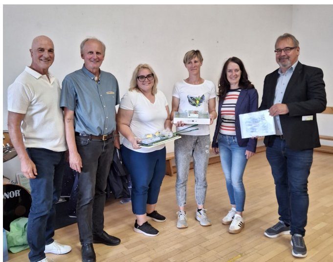
Naturparkkindergarten - Überreichung der Urkunden