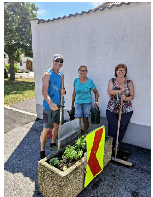
Fleißige Hände beim „Setzen“