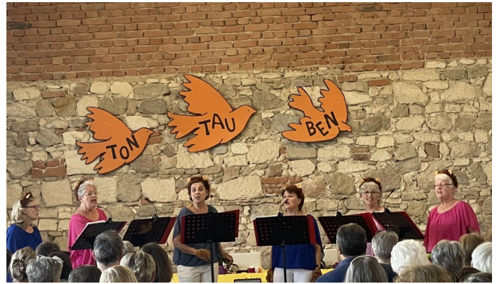
Tontauben Sommerkonzert 2026