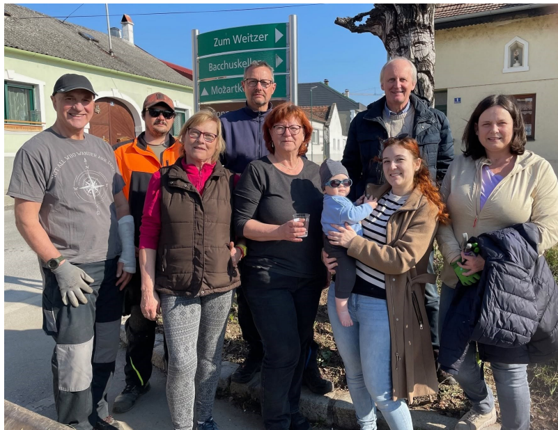
Grüninselpflege: Gemeinderäte, Verschönerungsverein, Gemeindearbeiter gemeinsam