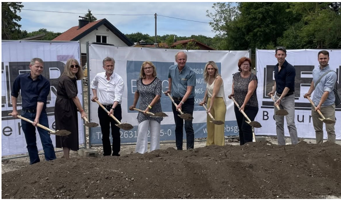
EBSG: Spatenstich zur Reihenhausanlage Seeblick