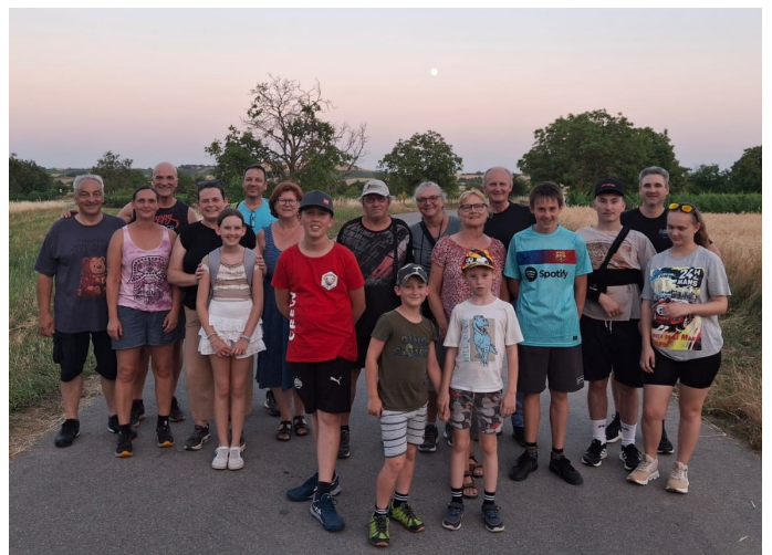
Mondscheinwanderung der SPÖ - „heißer Asphalt“