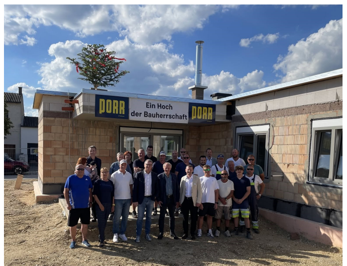
Gleichenfeier OSG - Häuser in der Rudolf-Heinz Straße