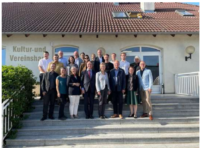
Besuch - UNESCO Delegation in Winden am See