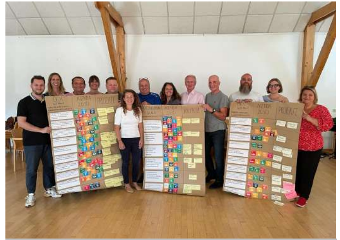
Agenda 2030 2. Workshop in Winden am See