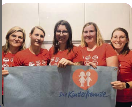
Mitglieder Kinderfreunde Wartberg/Aist; 2025

Wer Lust hat, mitzugestalten, mitzuhelfen oder einfach Teil unserer Gemeinschaft zu sein, kann sich gerne bei uns melden. Gemeinsam machen wir unseren Ort kinderfreundlicher!