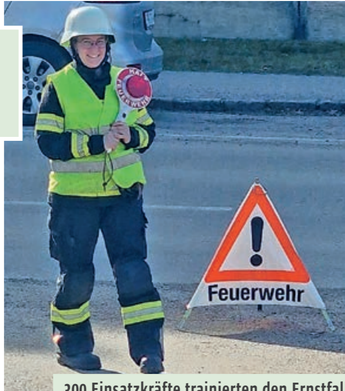
300 Einsatzkräfte trainierten den Ernstfall

Simuliert wurde unter anderem ein schwerer Verkehrsunfall im Gleisbereich, bei dem mehrere Personen in Fahrzeugen eingeschlossen waren. Präzises Arbeiten und rasche Koordination waren dabei entscheidend.