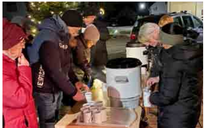
Tee- und Glühweinausgabe im Pfarrhof