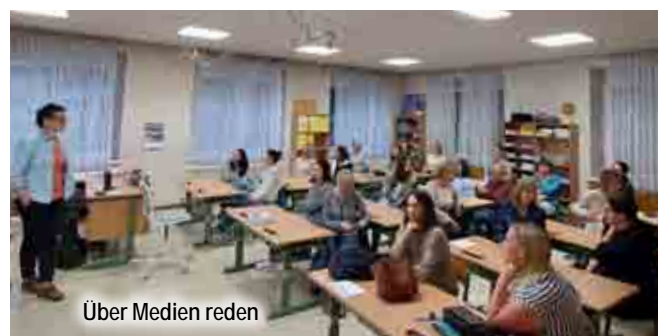
Über Medien reden