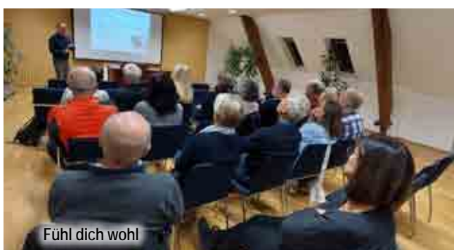
Fühl dich wohl