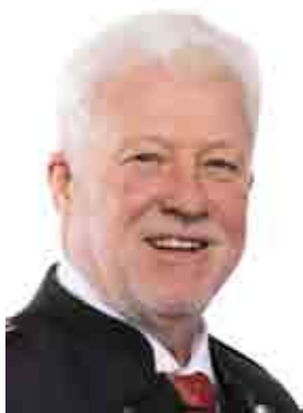
Bürgermeister Franz Zehner