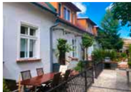
Bild oben: Straßenseite, Bild unten: Hofseite