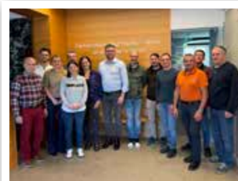
Über € 2.000 wurden von Vereinen und Gastronomen als Ergebnis des Faschingsumzugs zu Gunsten des Bürgermeister-Sozialfonds gespendet.