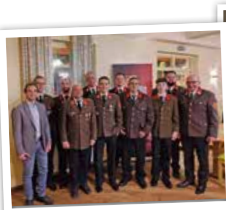
Die Kommandos der beiden Feuerwehren wurden wiedergewählt.