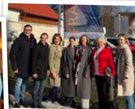
Der Weltfrauentag am 8. März wurde auch in BFB begangen.