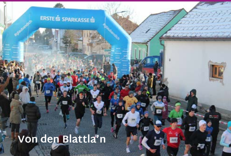
Von den Blattla'n