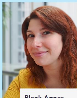
Blank Agnes Leitervertretung