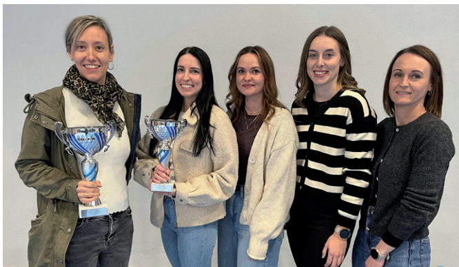
Wintercup – erfolgreich Damen