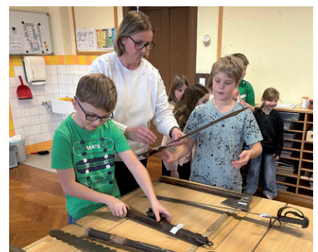
Die Exponate stellte Schulasistentin Silvia Wilfling zur Verfügung.