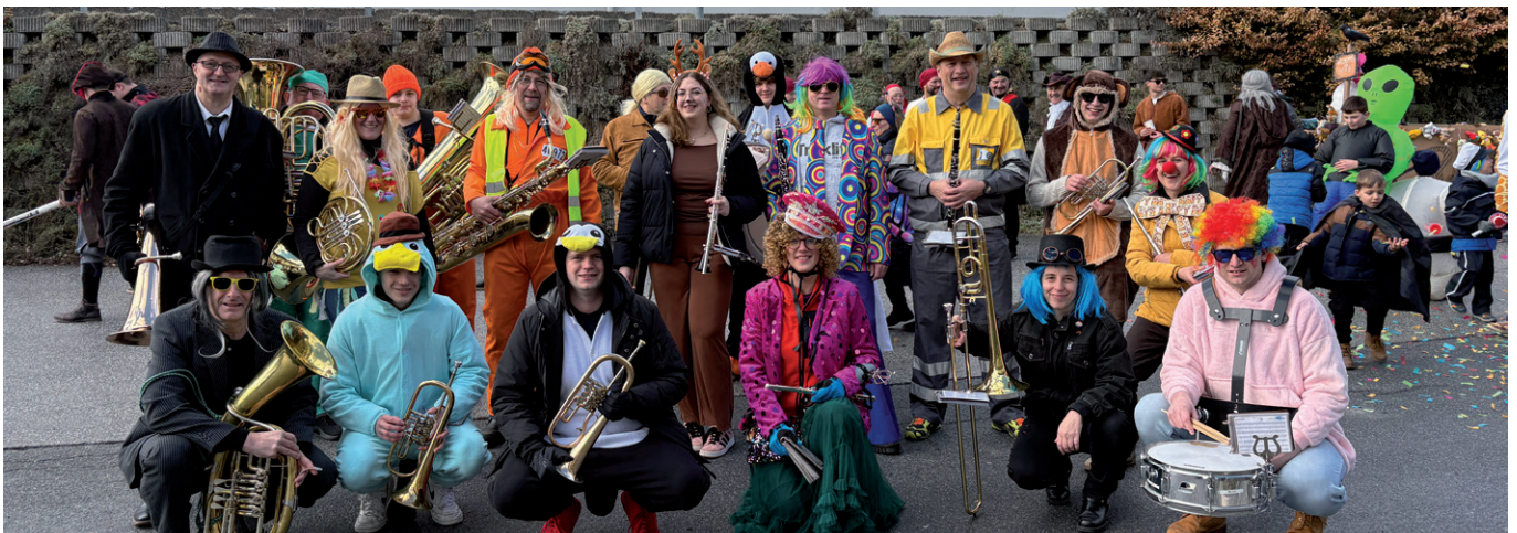
Der Musikverein durfte auch beim diesjährigen Faschingsdienstag nicht fehlen.

Am Faschingsdienstag fand wieder der traditionelle Umzug durch unser Dorf statt. Bei strahlender Stimmung zogen zahlreiche bunt geschmückte Gruppen, Vereine und Wagen durch die Straßen und sorgten für ein fröhliches Spektakel. Wir durften dies musikalisch umrahmen.