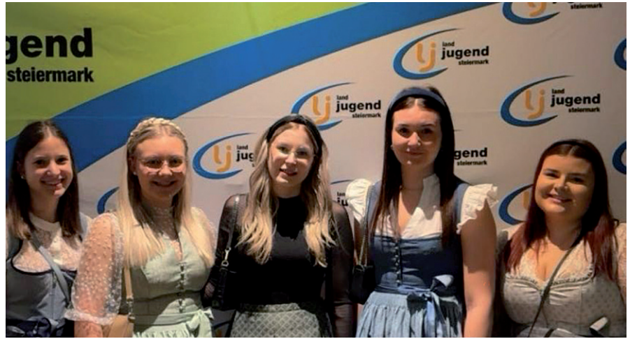
Die Landjugend Dechantskirchen in Hartberg.

Ein weiteres Highlight war der Faschingsdienstag am Dorfplatz in Dechantskirchen. Unser diesjähriges