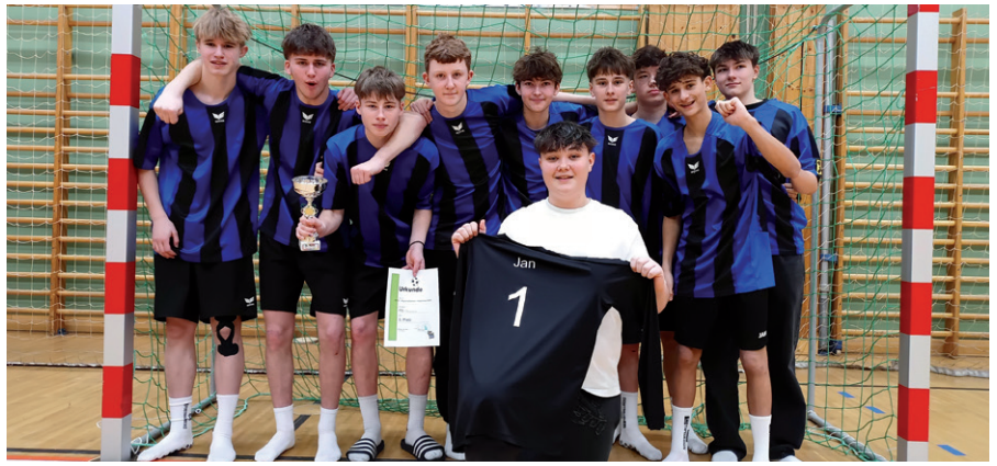
Der Poly Fußball Cup war insgesamt ein voller Erfolg und zeigte einmal mehr, wie wichtig Sport, Gemeinschaft und Fairness im Schulalltag sind.

AZE Technik, Kühlanlagen Postl) bis zum Sozialbereich (Kindergarten Pinggau) ist alles vertreten.