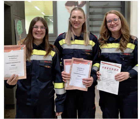
Erfolgreiche Teilnehmerinnen beim Funkbewerb.