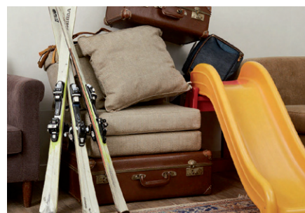
Typischer Sperrmüll: Schi, Koffer, größere Kunststoffteile, Polstermöbel, Teppiche ...

Diese Arbeit eines jeden Bürgers führt zu einer deutlichen Kostenreduzierung, da die Nachsortierung einfacher und kostengünstiger ist. In der Regel kann man sagen, dass alles, was nicht in die schwarze Tonne oder den Restmüllsack passt Sperrmüll ist und somit in das Altstoffsammelzentrum gebracht werden soll.