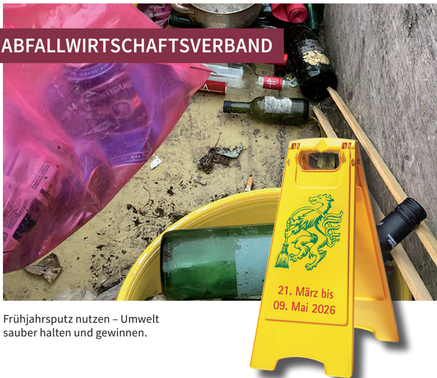
Frühjahrsputz nutzen – Umwelt sauber halten und gewinnen.