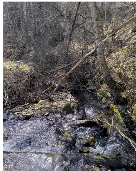
Ablagerungen in Bächen können Hochwasser verursachen.

In unserer Gemeinde wird die Wildbachbegehung im Zeitraum Frühjahr/