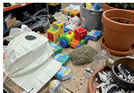
Typischer Restmüll: Spielzeug, Blumentöpfe, kalte Asche, Glühbirnen, Hygieneartikel, Staubsaugerbeutel ...

Für weitere Informationen stehen wir Ihnen gerne unter 03339/22 408 zur Verfügung.