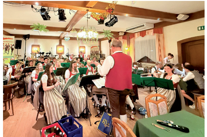
Bei der Trochtn Nocht im GH Schwammer.

Nach dem großen Erfolg im vergangenen Jahr ging der Ball des Musikvereins unter dem Motto „Trochtn Nocht“ heuer erneut über die Bühne. Gefeierte wurde am 10. Jänner im Gasthof Schwammer. Für die musikalische Umrahmung sorgten in diesem Jahr die Stadtkapelle Kirchschatz in der Buckligen Welt und die Mooskirchner, die mit ihren Klängen für beste Stimmung sorgten. Auch die Weinbar- Shotbar und Bar waren wieder ein beliebter Treffpunkt. Auch heuer sorgte wie-