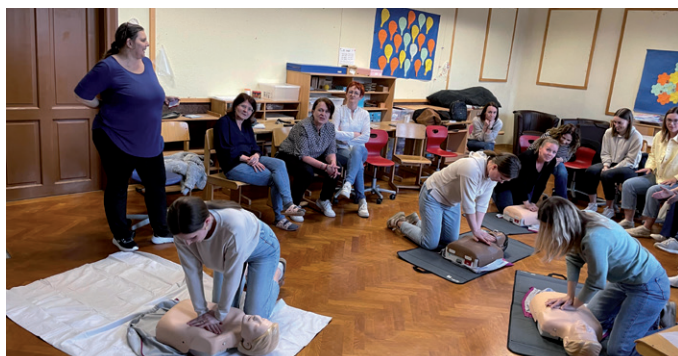
Direkt bei einem Dummy den Notfall üben.