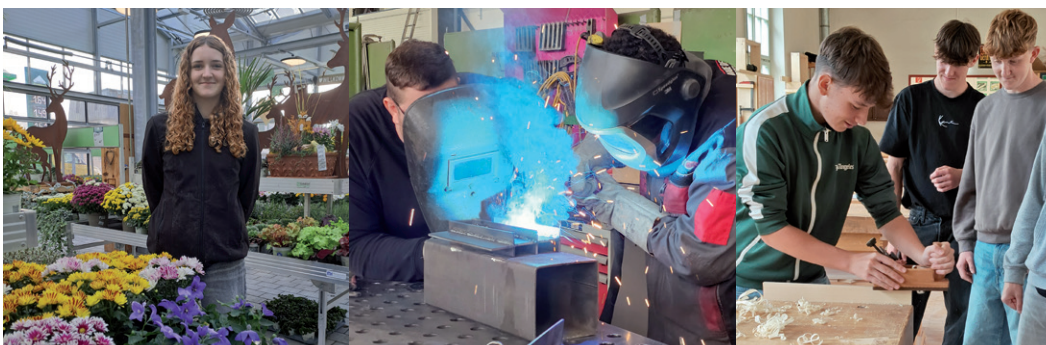
5 Wochen Praxis: Erfahrungen sammeln in den verschiedensten Bereichen.