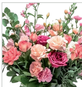
Otto Ringbauer 80 Jahre