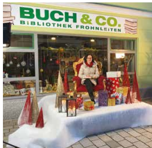
Die Live-Lesungen freitags, samstags und sonntags im Dezember (bis 23.12.) sind fixer Teil des Frohnleitner Weihnachtszaubers