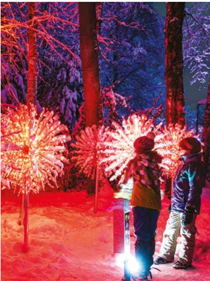
Einzigartige Lichterlebnisse bietet „Lumagica Frohnleiten“ am Murhof für große und kleine Gäste

Die Advent- und Weihnachtszeit wird in Frohnleiten heuer noch besonderer als sonst. Neben der traditionellen Beleuchtung der Silhouette und dem Weihnachtszauber im und um das Zentrum der Stadtgemeinde soll „Lumagica Frohnleiten“ am Murhof rund 50.000 Besucher:innen in unsere Region bringen, wie Markus Lientscher und Astrid Perna-Benzinger vom Veranstalter der Kulturagentur Ivents ankündigen.