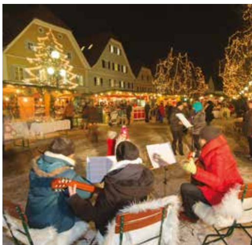
Der Christkindlmarkt und Musikensembles werden die Besucher:innen am Hauptplatz verzaubern