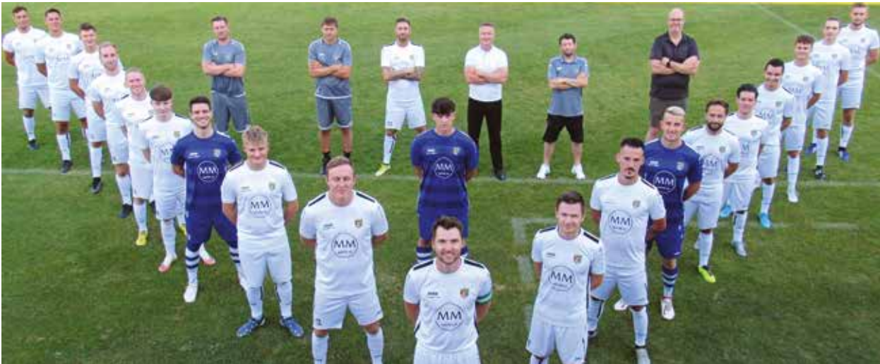
Hofft auf einen Aufwärtstrend im Frühjahr: die Kampfmannschaft des SV MM Frohnleiten