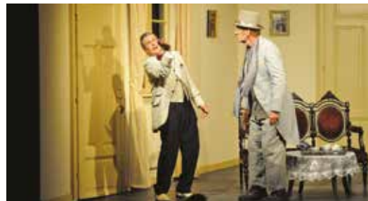
Lügen und Verwechslungen sorgen für schier unglaubliche Turbulenzen zum Amüsement des Publikums

Nach dem Lachschlager „Mrs Markham“ im Vorjahr sorgt das Team des Theaters Frohnleiten unter der Regie von Alfred Haidacher mit dem „Floh im Ohr“ für köstliche Unterhaltung auf der Sommerbühne mitten im Zentrum der Stadtgemeinde. Das Stück von Georges Feydeau ist eine Verwechslungskomödie basierend auf einer Reihe von Lügen, die auf die Doppelmoral des Bürgertums abzielt. Das Stück ist noch bis 30. Juli zu sehen. Termine und weitere Infos finden Sie im Frohnleitner Veranstaltungskalender und auf www.theater-frohnleiten.at .