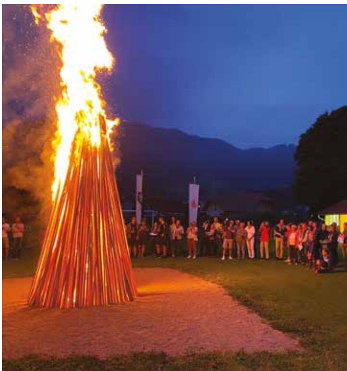
Mit dem Entzünden des Feuers klang der Abend mit traditionellen Liedern und Musik sowie perfekter Verköstigung durch das Turnvereins-Team für die Gäste aus