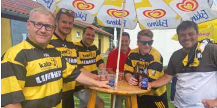
Eine Runde zum Trost für die Eishockey-Cracks nach dem verlorenen Spiel gegen die Volley-Frogs

nier am 23. und 24. Juli am Rainer-Gollesch-Turnplatz steht schon demnächst das nächste Großereignis und zugleich der sportliche und gesellschaftliche Höhe-