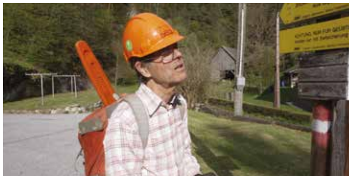
Freimachen der Wege und deren Markierungen bedeuten umfas- Frohnleiten