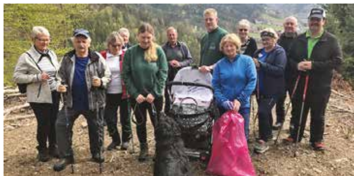
In Frohnleiten sind es auch dankenswerterweise viele Vereine und Gruppen, die Wege, Wiesen und Flure säubern

Wasserkocher, Leuchten, Headsets, Smartphones, Notebooks, Waschmaschinen etc. Die Infos