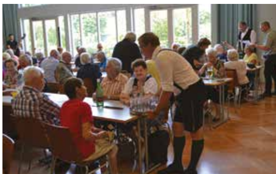
Mit Können und Charme packten die Gemeinderät:innen beim Servieren mit an