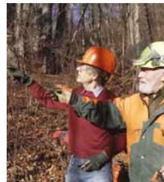
Egal ob im Badlgraben, am Gschwendt oder am Jöllersattel, das sende Arbeiten für die gesamte Mannschaft des Alpenvereins Frohnleiten