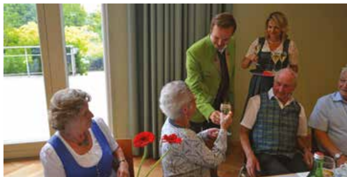
Persönlich anstoßen und ein Tratscherl mit den Jubilar:innen gehörte ebenso dazu

für die Partnerbetriebe und den Reparaturbonus finden Sie auf https://www.reparaturbonus.at