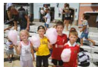
Action mit Bullenreiten und Trampolinspringen, Spaß beim Entenziehen und süße Naschereien waren nur einige der zahlreichen Attraktionen, die den Kindern unvergessliche Stunden bereiteten