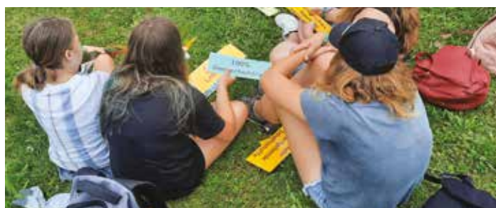
Viel an Wissen wurde von den Kindern aufgenommen und auch nach Hause mitgenommen