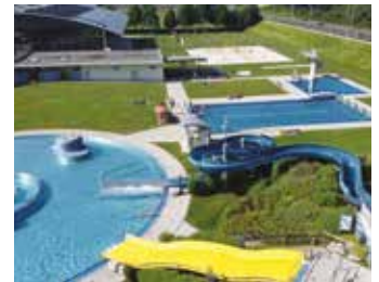
Der Sport- und Freizeitpark war die perfekte Location

reich jene, die meist in Sport- hallen ausgeübt werden.