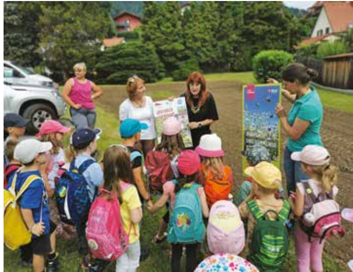
Am Grünanger sind für Herbst weitere Flächen für Wildblumenwiesen geplant. Die Kindergartenkinder haben mit viel Elan Pflanzen gesetzt und geben der Artenvielfalt mehr Chance

Um solche Wiesen und Lebensräume zu fördern, werden im Regionsprojekt „Klima- und ressourcenstarke Region Steirischer Zentralraum“ gemeinsam mit dem Regionalmanagement und dem Verein „Die Wasserschutzbauern“ ungenutzte Grünflächen zu