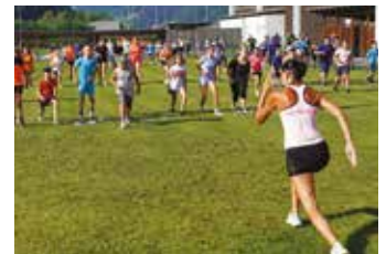
Vor dem Start wurde einmal ordentlich aufgewärmt