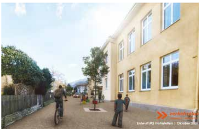
Die Neubauten beim Schulweg erfordern umsichtige Adaptierungen der Verkehrsflächen für Schule und Anrainer:innen

Im Bereich des gesamten Bildungszentrums werden verkehrsberuhigende Maßnahmen gesetzt, die Ende Juli starten. „Zielsetzung bei diesem Verkehrsprojekt ist es, die Sicherheit für die Schüler:innen zu verbessern und den Individualverkehr durch das Bringen und Abholen durch die Eltern zu reduzieren“, erklärt Bgm. Johannes Wagner. So soll dieser Raum vor der Schule ein sicherer Bereich für alle Schüler:innen werden – mit einer Platzsituation, die Aufenthaltsmöglichkeiten und sichere Wege gewährleistet.