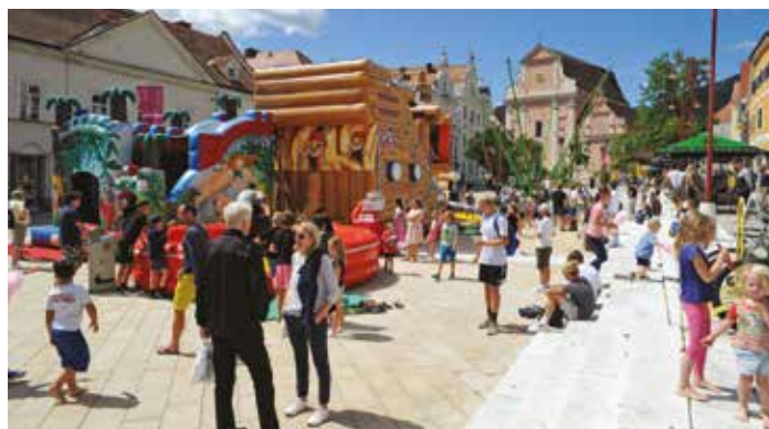
Der Hauptplatz wurde an diesem Nachmittag zum Rummelplatz mit Volksfestcharakter und sorgte für ausgelassene Stimmung sowohl bei den Kindern als auch bei den Erwachsenen