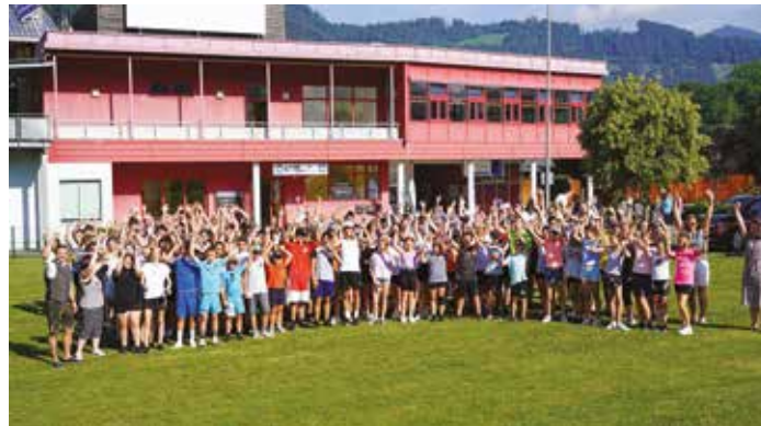
Die Mittelschüler:innen freuten sich über die Einladung