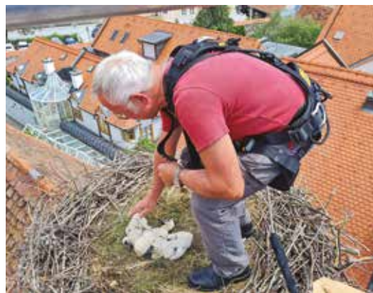
Ein spektakulärer Einsatz war notwendig, um dem Storchennest zu helfen

Die Frohnleitner*innen sind aufgerufen ihren Wunsch-Namen an stadt-