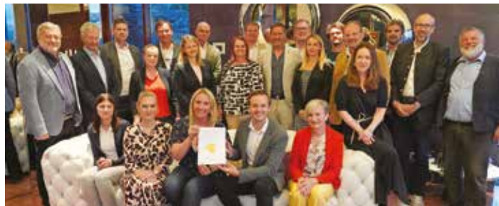
Die gesamte Leadergruppe beim Treffen auf der „Keusche“ von Burg Rabenstein