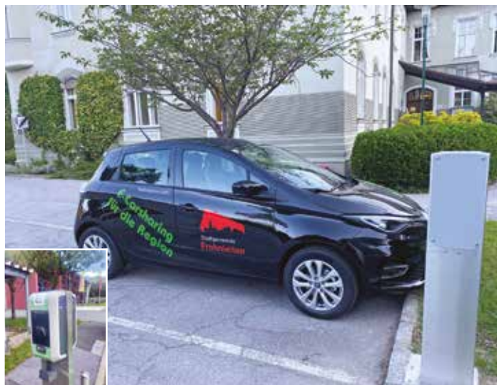
Mit der Frohni lässt sich vieles umweltschonend erledigen. Die E-Ladestationen sorgen für entsprechende Versorgung

Initiiert wurde dieses Projekt durch die KEM Graz-Umgebung Nord ( https://www.energie-gunord.at/e-car-sharing/ ), die es auch ständig begleitet.