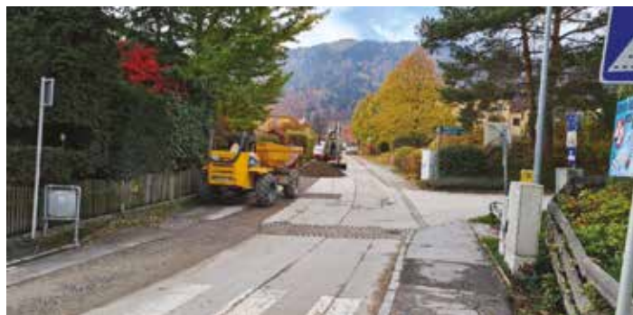
Die Erneuerung der Wasserleitung im Vorjahr ist Grund und Anlass für die Bauarbeiten zur Verbesserung der Verkehrsflächen in der Dr.-Ammann-Straße