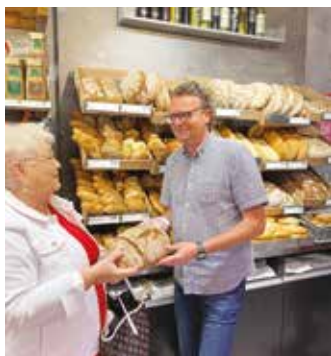
Gebäck-Aktion bei Spar Tuller: Vom 23. – 30. Juni gibt es Viertler-Weckerl 2+1 gratis

Wie wichtig regionale Produkte für unsere Versorgung sind, wurde uns in den letzten Wochen und Monaten explizit vor Augen geführt.