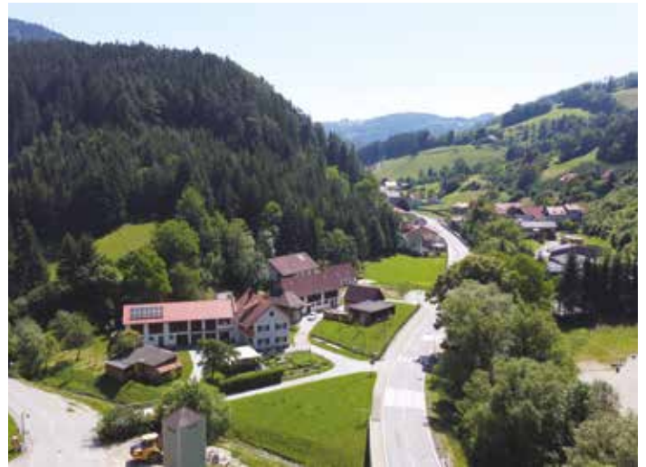
Aus drei mach eins: Die Zusammenlegung von Röthelstein, Schrems und Frohnleiten erfordert ein neues Örtliches Entwicklungskonzept