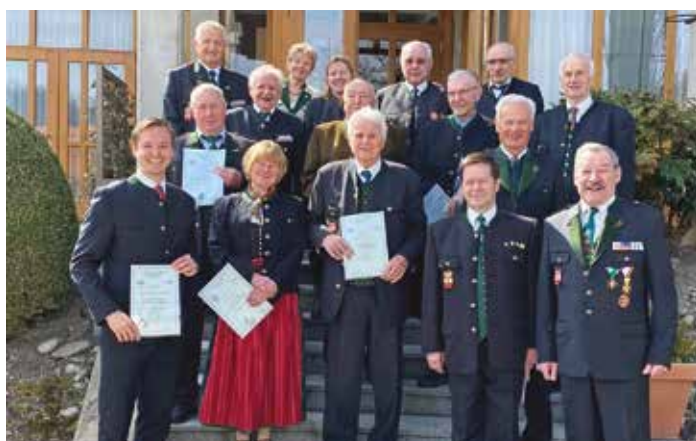
Der ÖKB Frohnleiten mit seinen geehrten Persönlichkeiten und Mitgliedern nach der Versammlung in Adriach

Trotz schwieriger Umstände in den vergangenen beiden Jahren konnten für ein krankes Kind in Frohnleiten 1.500 Euro und für das Schwarze Kreuz 500 Euro gespendet werden. Das geplante ÖKB-Fest wurde aus Planungsgründen, die der Pandemie geschuldet sind, vorderhand abgesagt.