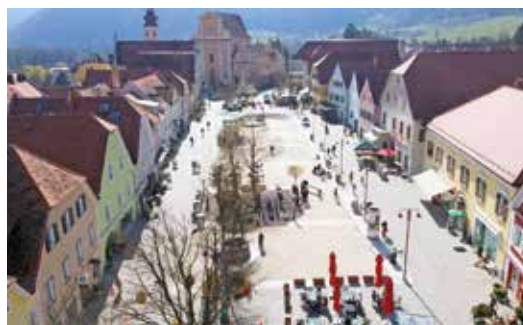
Reges Treiben von Besuchern auf dem Hauptplatz sind die Folge der Osteraktion und des Engagements vieler Helfer*innen