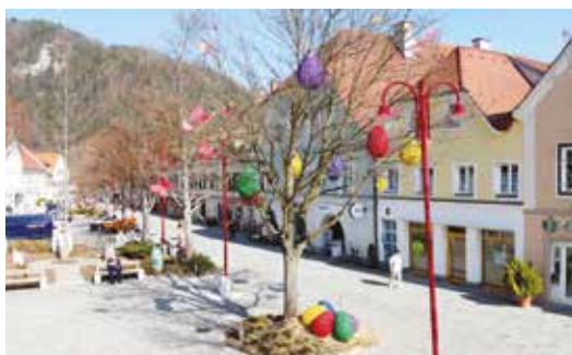
Bunte Schmetterlinge auf den Bäumen signalisieren zu Ostern nun auch den Start in die warme Jahreszeit