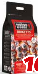
Grillbriketts "Weber", 8 kg, per Sack