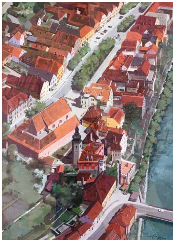
Frohnleiten aus der Vogelperspektive (Gouache)