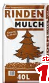
Rindenmulch 40 Liter, per Sack

GROSSE AUSWAHL Balkonblumen • Ampelpflanzen • Kübelpflanzen • Beetpflanzen • Gemüsepflanzen