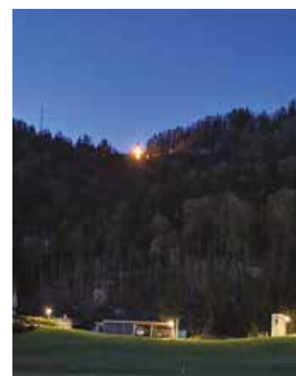
Osterzeit ist's, sagt uns das helle Kreuz am Schlöglmoar, oberhalb von Wannersdorf

Die Tradition der Osterfeuer wird in Frohnleiten groß gepflegt. Die größeren dieser Brauchtumsfeuer hat es in Adriach auf der Waidacher Wiese, unmittelbar vorm Dorf und in Wannersdorf beim ehemaligen Wastlbauer gegeben, wobei die Veranstalter