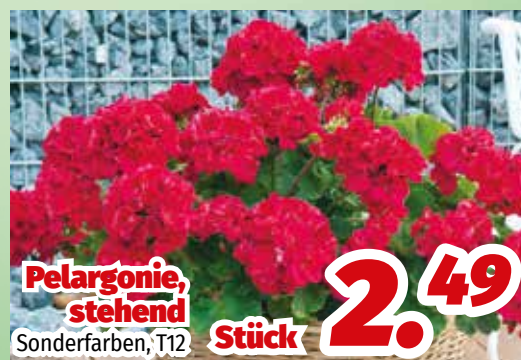
Pelargonie, stehend Sonderfarben, T12