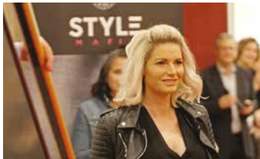
Beim Art&Business Kick-off zeigte Style-Mafia coole Mode am roten Teppich

Jung und frech ist der Stil, dem sich beide verschrieben haben. Nachdem das Online-Geschäft ausgezeichnet angelaufen ist, öffnet Style Mafia nun auch jeden Freitag den Shop in der Grazer Straße 10. So kann man