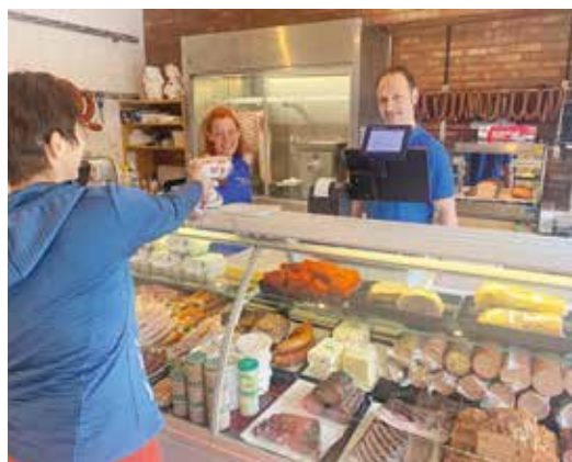
Die Kunden dürfen sich auf regionale Produkte, top Qualität und bestes Service im Geschäft in Rothleiten freuen