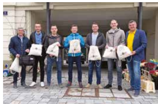
Der Lions Club Frohnleiten und Lions Österreich spendeten 80 Hygiene-Bags und einen Laptop den Flüchtlingen in Frohnleiten

Auch die Hilfsbereitschaft in der Bevölkerung ist groß: „Wir sind froh darüber, dass sich so viele Menschen bereit erklärt