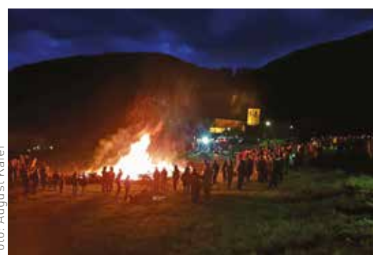
Mehrere hundert Besucher fanden sich beim großen Osterfeuer in Adriach ein und feierten diesen Brauch