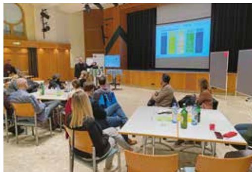
Beim Workshop in Gratkorn am 16.3. wurden viele Ideen gesammelt, die in den gesamten Strategieprozess einfließen werden

Wesentlich bei diesem Prozess ist die Einbindung aller Bürgerinnen und Bürger, die bestimmen sollen, welche Schwerpunkte das Leader-Projekt verfolgen soll. Es geht dabei um strategische Ansätze, die für die Zusammenarbeit in der Zukunft wichtig sind. Österreichweit gibt es zahlreiche erfolgreiche Regionen, die mit Hilfe von Förderungen in der Lage waren, Investitionen zu tätigen, die allen Menschen