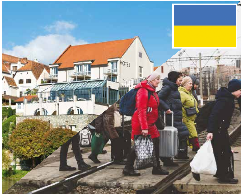
Rund 40 ukrainische Flüchtlinge sind bisher in Frohnleiten angekommen