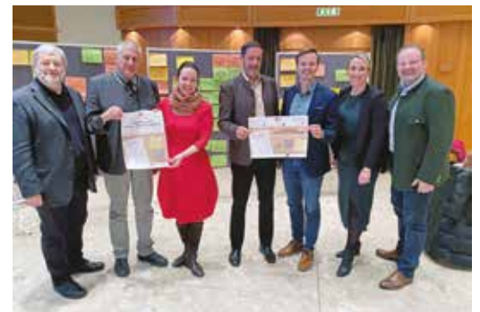
Das Regionalmanagement und Vertreter der Gemeinden setzen auf Bürgerbeteiligung und rufen auf, mitzugestalten

der jeweiligen Region zugekommen sind. Ein herausragendes Beispiel dafür ist gleich unsere Nachbarregion, das Almenland, das in den vergangenen zwei Jahrzehnten eine konsequente strategische Entwicklung vorangetrieben und auch dafür gesorgt hat, dass die Region selbst unter dem Namen „Almenland“ sich zu einer internationalen Marke entwickelt hat.