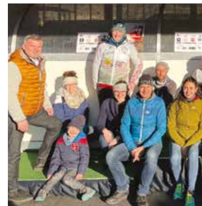
Freuen über ein erfolgreiches Lauf- und Vertreter der Stadtgemeinde Frohnleiten