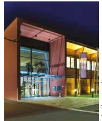
Eine Kombination aus Bildern, Wirtschaft und Fashion spannt den Bogen eines spannenden Abends im Technologiepark Frohnleiten