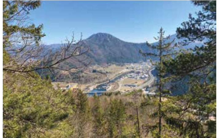
Waldreiche Gemeinde: 82 Prozent der Fläche Frohnleitens sind mit Wald bedeckt