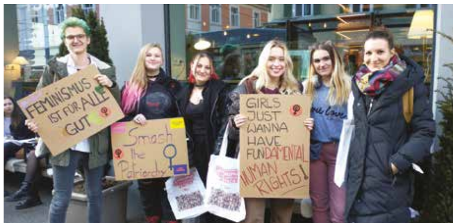
Das JUZ Frohnleiten demonstrierte für Gleichberechtigung am 8. März in Graz

Die jungen, engagierten Leute richten sich mit ihren Aktionen an alle, die sich für die Gleich-