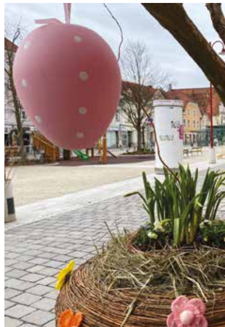
Die Geschäfte sind eingeladen, mitzumachen und in das bunte Ensemble mit einzustimmen