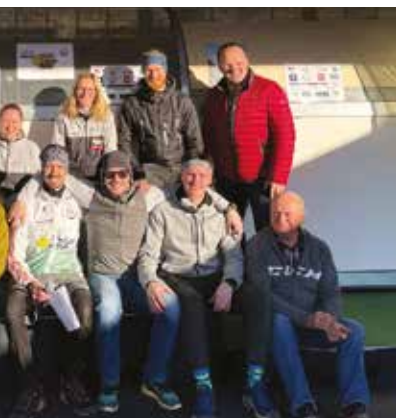
Event durften sich die Veranstalter Frohnleiten