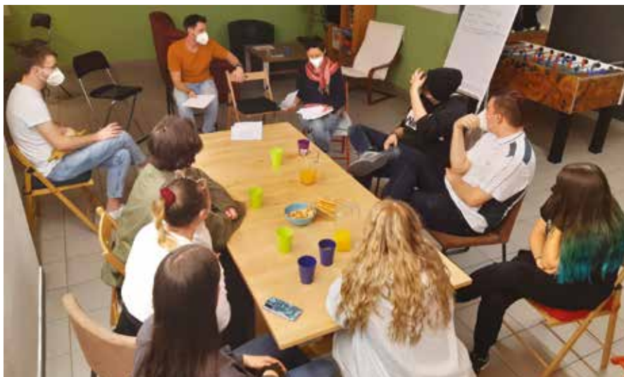
Rege Diskussionen und Anregungen gab's beim Stammtisch am 11. Februar im JUZ

Das JUZ möchte gemeinsam mit jungen Frohnleitner*innen ein junges, lautes und feministisches Lebenszeichen von sich geben. So sind im ganzen März verschiedene Aktionen anlässlich des Weltfrauen*tags am 8.3. geplant, im Jugendzentrum und im öffentlichen Raum. Die genauen Termine der einzelnen Aktionen werden über die Social Media Kanäle des Jugendzentrums bekannt gegeben (Facebook, Instagram)