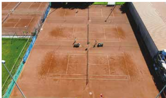
Die Tennissaison am Gottsbergerweg 12 beginnt, sobald das Wetter es zulässt, ca. Mitte April