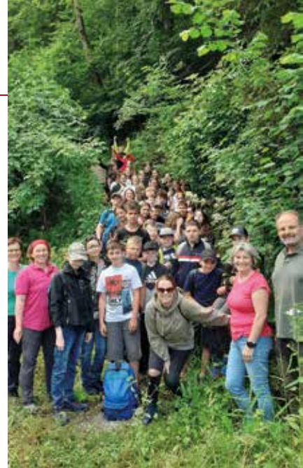
Waldausgänge mit KLAR sind fixer Bestandteil des Erlebnis-Unterrichts Natur und ihrer Bedeutung