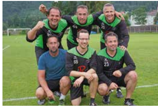
Neben einem top-organisierten Event gab es mit dem 3. Rang auch einen Stockerlplatz für die Mannschaft MM 1 beim Heim-Turnier 2023

D ass Faustball einen hohen Stellenwert in Frohnleiten innehat, bewies einmal mehr das Turnier, das am 22. Juli am Rainer-Gollesch Turnplatz stattgefunden hat. In der Steiermark ist man sowieso unumstritten die Nummer 1, wenn es um diesen Sport geht. Traditionell kommen auch die Mannschaften aus ganz Österreich zusammen, wenn die Frohnleitner zum Turnier einladen, wie die beiden Siegermannschaften aus Enns und aus Froschberg, die heuer das sportliche Geschehen dominierten. Neben den spannenden und absolut lässig zuzuschauenden Matches sind es die perfekte Organisation und die bewährte Quali-