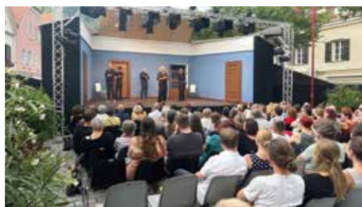
Die über 100 Zuschauer:innen zeigten das Potenzial dieses Formats auch in Frohnleiten auf