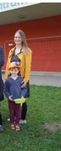
Fast schon zum Mitarbeiten ausgestattet waren die Pinocchio-Kindergartenkinder beim Baustellenbesuch