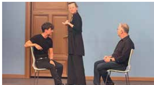
Die Gruppe „Mord vor Ort“ demonstrierte den Spaß an der Improvisation