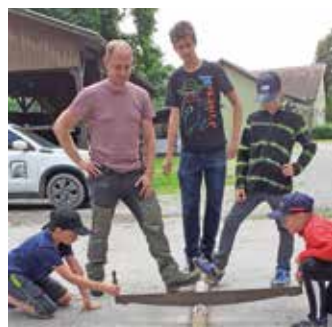
Selbst Hand anlegen gehört ebenso dazu wie der wissenschaftliche Blick durch Mikroskop