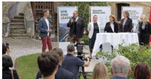
Gemeinsame Auftritte und Kommunikation sollen das Regions-Bewusstsein stärken und als Katalysatoren für regionale Projekte dienen