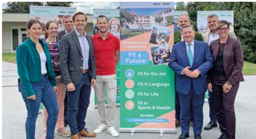
Wirtschaft, Politik und Schule sind sich einig: ein nachhaltiges und zukunftsorientiertes Bildungskonzept

„Fit for the Job“ bereitet ab der 3. Klasse intensiv auf die Bildungs- und Berufswelt vor. Das Unterrichtsfach „Das Geld und ich“ in der 4. Klasse vermittelt Grundlagen der Finanzbildung. Zusätz-