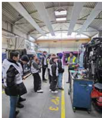
MS@work gibt Schüler:innen tiefe Einblicke in die Berufe und die Praxis

wird und mit zahlreichen sprachfördernden Veranstaltungen und Projekte ergänzt wird