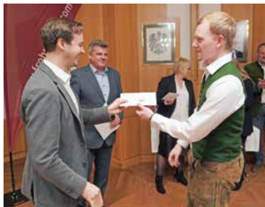
Im Jänner ist es wieder so weit, da erfolgt die feierliche Übergabe der Frohnleitner Gutscheine an die Lehrlinge

Die Förderung kann noch bis Ende des Jahres beantragt werden. Das Formular dafür steht zum Download auf www.frohnleiten.com bereit. Die feierliche Übergabe der Gutscheine wird