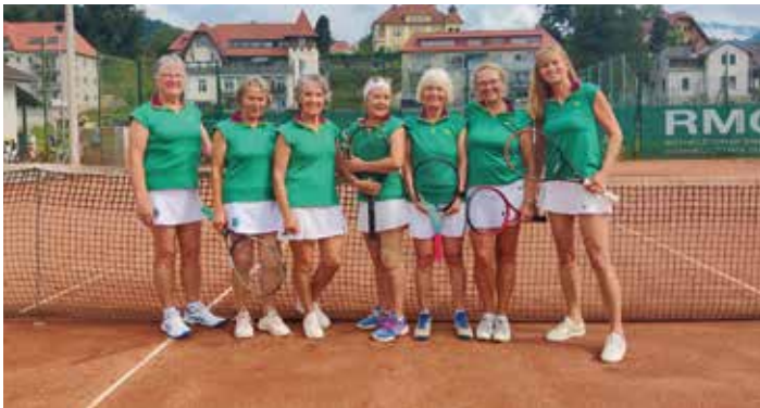
Meisterinnen! Die Senioren Damen 65+ des TC Frohnleiten