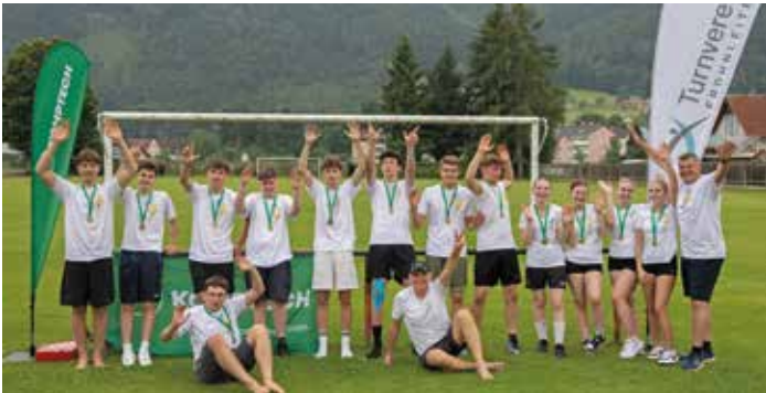
Bevor die Medaillen vergeben werden konnten, hieß es „Tempo machen!“

ten, Weit- und Hochspringen sowie Schlagballwerfen auf dem Programm, ebenso ein Slalom-Parcours mit dem Ball. Die Jugendlichen haben sich bestens geschlagen, wurden danach mit einem T-Shirt und einer Medaille belohnt, bevor Catering Grabmayer mit Grillspezialitäten alle verwöhnt hat.