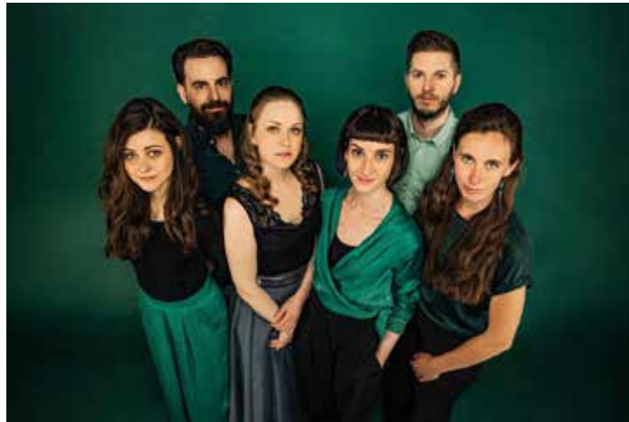
Einen Tag vor dem Konzert in Adriach tritt das Ensemble „opia“ mit ihren gegenwärtigen Interpretationen Alter Musik noch im Brucknerhaus in Linz auf

Wie gewohnt gibt es eine Stunde vor Konzertbeginn die Konzerteinführungen um 18.00 Uhr, die direkt vor der Kirche stattfinden.