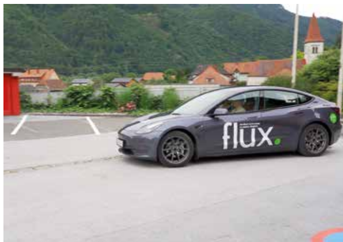
Mit dem Flux Taxi ist man flexibel unterwegs – in der gesamten Region

Die Buchung ist online unter „buchung.flux.at“ oder telefonisch unter 050 616263 möglich und ganz simpel: Start und Ziel auswählen, gewünschte Abhol- oder Ankunftszeit bekanntgeben und schon kann unter den vorgeschlagenen Verbindungen eine Fahrt gewählt werden. Wer von den Hauptknotenpunkten, in Frohnleiten ist dies der Bahnhof und das Postamt, startet, zahlt für die Fahrt innerhalb des Gemeindegebietes maximal 5 Euro. Weitere Infos gibt es auf www.flux.at .