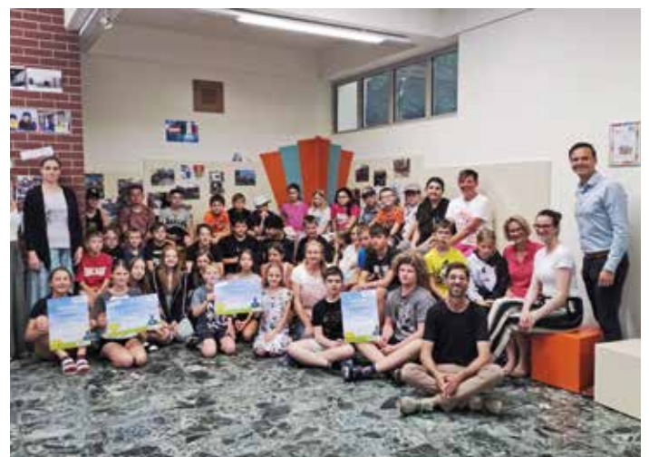
Die Energieteams der beiden Schulen spürten zahlreiche Energiefresser auf

während des Projektes mehrmals, um Messungen durchzuführen, Energiedaten zu erheben und auszuwerten, die Mitschüler:innen zu informieren und Energiefresser aufzuspüren. Das Ergebnis kann sich sehen lassen. So konnten in der MS und VS Frohnleiten schließlich zehn Prozent, das sind € 1.634,00 an Energiekosten und 7,1 t CO 2 eingespart werden, wovon 50 Prozent der Schule in Form eines Einsparungschecks von Bürgermeister Johannes Wagner übergeben wurden.