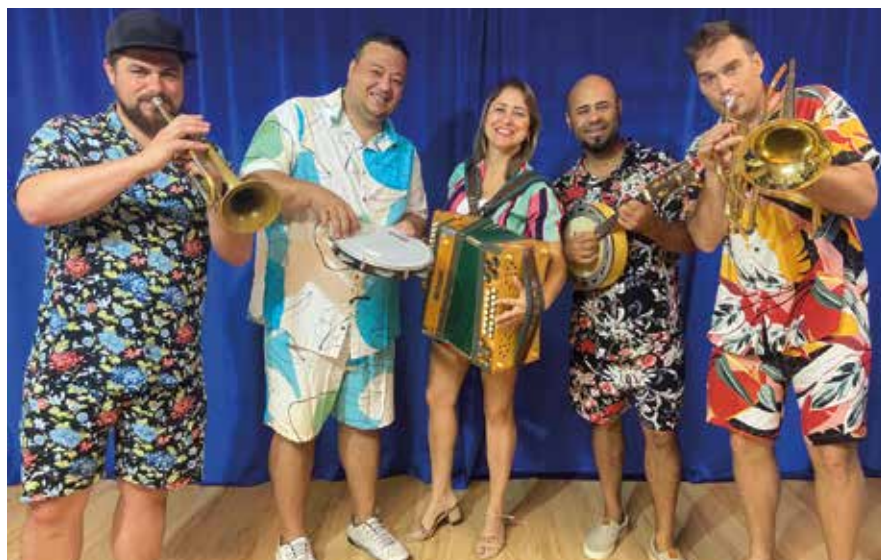
Die Austro Brazil Connection sorgt am 23. August für südamerikanisches Flair im „Parque Romano“

Styria meets Brazil oder Lederhose trifft auf Copacabana-Style, so könnte man die musikalische Begegnung am Freitag, dem 23. August ab 17.00 Uhr im Römerpark bezeichnen, wenn die Poldi-Hausmusi und die Austro Brazil Connection aufspielen. Es ist auch ein einzigartiges Aufeinandertreffen von Polka und Samba, eine Mischung, die Rhythmus im Blut hat und die man nicht versäumen sollte. Drinks und kulinarische Spezialitäten vom Café Römerpark sorgen zusätzlich für einen genussvollen Abend.