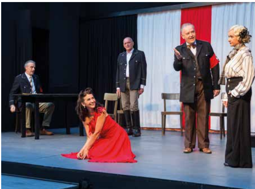
Theater Frohnleiten hat das Warschauer Ensemble des Polski-Theaters in die Gegenwart geholt und seine Gäste bei den Aufführungen köstlich unterhalten