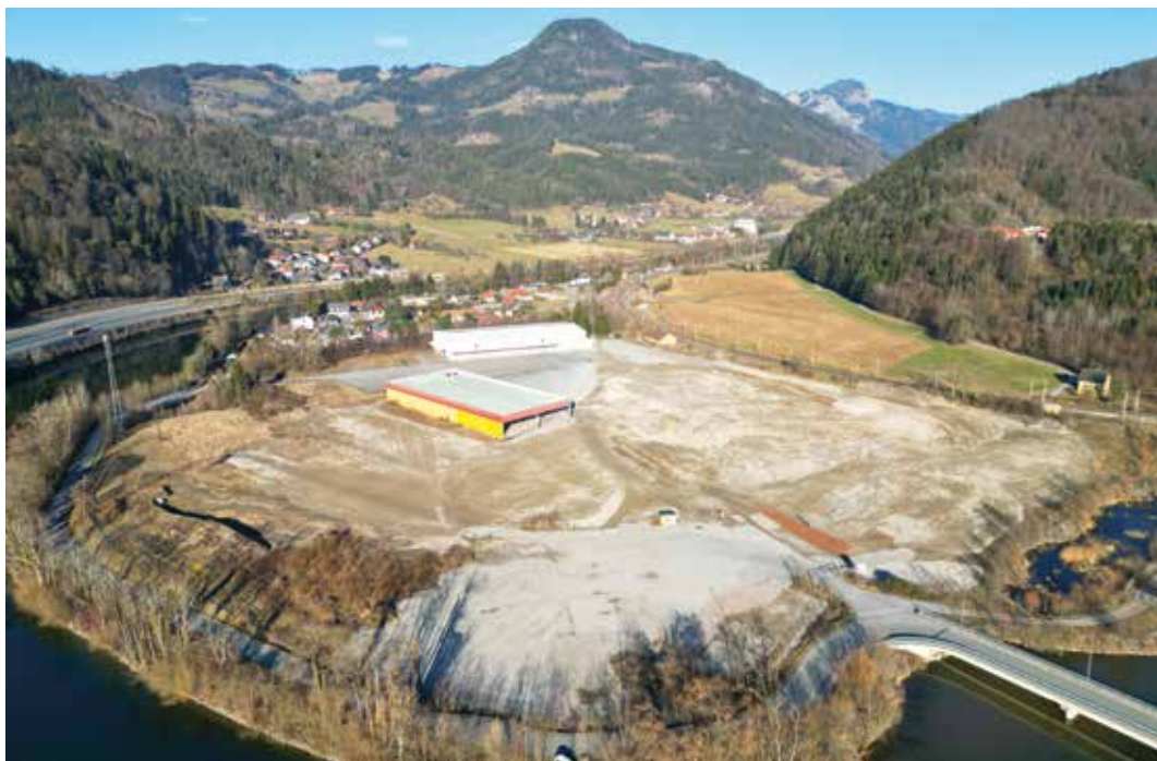
Der Ankauf der Peugen-Gründe ermöglicht aktive Standortentwicklung und die Schaffung neuer Arbeitsplätze, ohne zusätzliche Flächen zu versiegeln

Für den Standort Frohnleiten ist es damit möglich, neue Arbeitsplätze für Frohnleiten:innen zu schaffen, ohne für die Ansiedelung neuer Betriebe zusätzliche Flächen zu versiegeln.