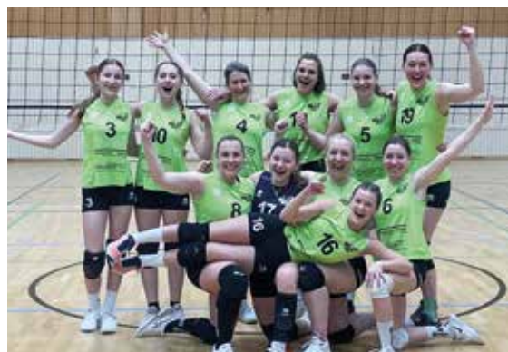
Teamgeist und Kampfgeist zeichnen die Volley Frogs und ihren Nachwuchs aus, die von den Fans immer frenetisch angefeuert werden