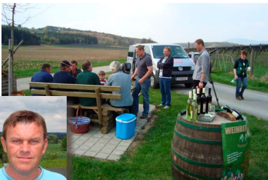
Eine zünftige Jause mit frischem Kren und gutem Wein schmeckt nach getaner Arbeit in freier Natur besonders gut