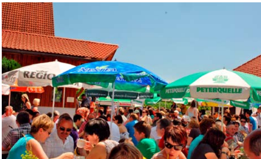
... großes Gedränge am Hof

aus der Gemeinde fanden bei den Gästen großen Anklang.