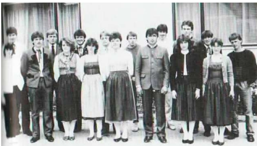
Die Landjugend Gschmaier im Jahre 1985

Aber auch in anderen Bereichen ist die Landjugend sehr aktiv. Neben dem jährlichen Kapellenfest, mit dessen Einnahmen z.B. Ausflüge, Mitgliedsbeiträge an die LJ-Weiz und andere anfallende Vereinskosten finanziert werden, wird jedes Jahr die Erntekrone für die Pfarrkirche Ilz von der LJ Gschmaier gefertigt. Außerdem gibt es auch jedes Jahr die Nikolausaktion, das Maibaumaufstel-