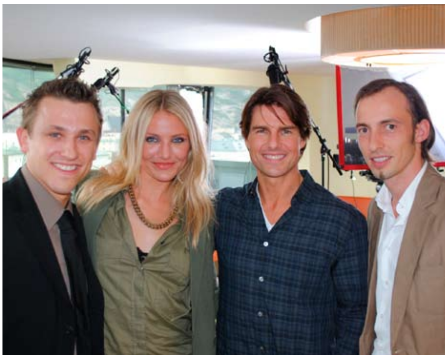
Die bekannten Hollywood-Schauspielstars Tom CRUISE