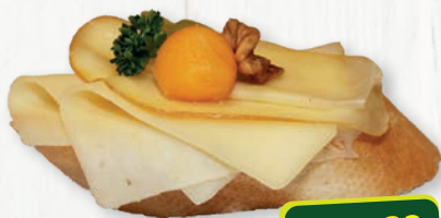
Brötchen mit Käse (nach Auswahl)