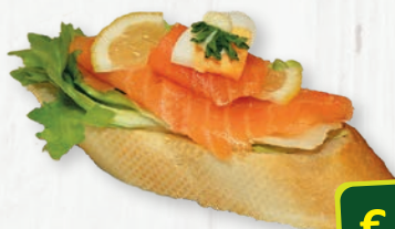
Brötchen mit Lachs