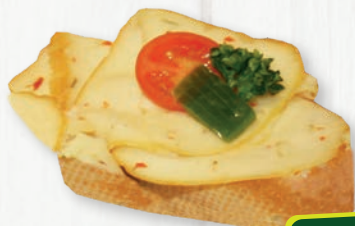
Brötchen mit Pikantkäse