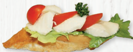
Brötchen mit Tomaten & Mozzarella