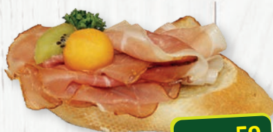
Brötchen mit Karreespeck (rustikal)