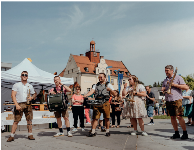
Der Blumen- und Genussmarkt wurde mit den belgischen Musiker:innen "Die Fröhlichen Trappisten" musikalisch umrahmt. Beim Dämmerchoppen der Freiwilligen Feuerwehr am Abend gab es einen neuerlichen Auftritt der Musiker:innen.