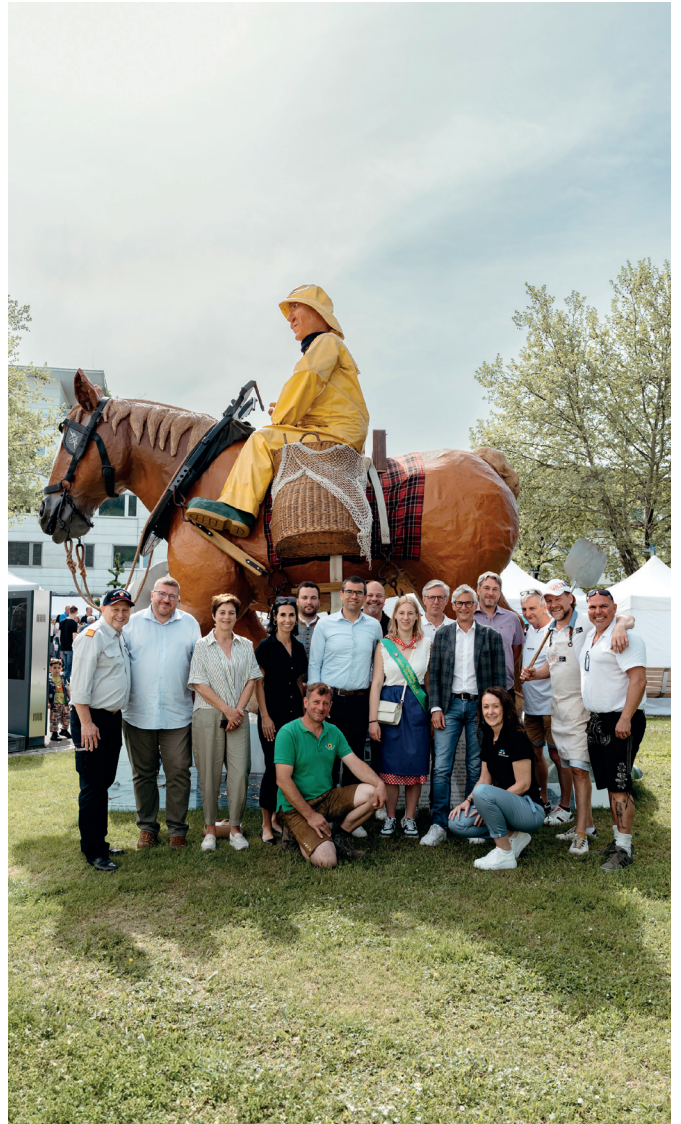
Das Verbrüderungskomitee aus Koksijde und Bad Schallerbach besuchte nach einem Arbeitsfrühstück noch den Blumen- und Genussmarkt und traf sich beim "Pferdefischer", welcher extra für das Jubiläumsfest von Koksijde nach Bad Schallerbach transportiert wurde, mit Vorstandsmitgliedern des Vereins WIR.BadSchallerbach.