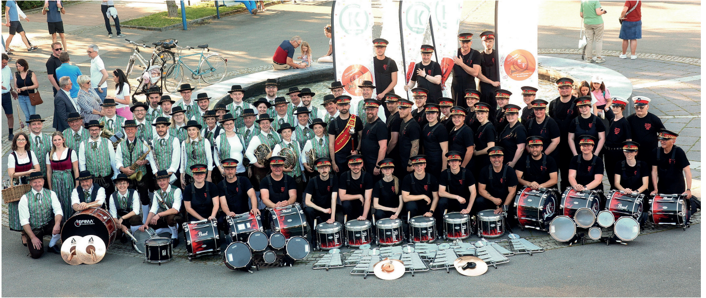
Das Showkorps "El Fuerte" gab am 2. Mai am Rathausparkplatz ein Showkonzert zum Besten und marschierte anschließend mit der Marktkapelle Bad Schallerbach und den Ehrengästen zum Atrium, wo im Anschluss ein Festabend anlässlich 70 Jahre Verbrüderung Koksijde-Bad Schallerbach stattfand.